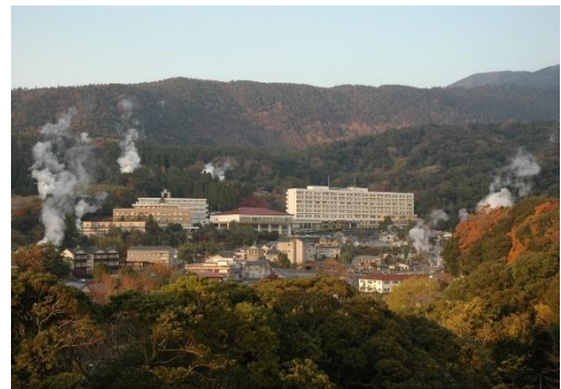
■ 豊かな自然と調和した霧島温泉郷