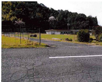
2 道路から見た全景