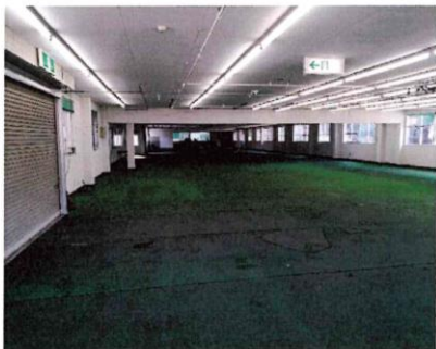
9 西から見た作業場