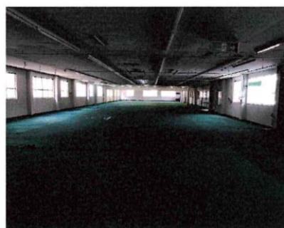
8 東から見た作業場