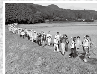
東京みぞべ会と地元が協力して、ふるさとウォークが9月23日、溝辺町竹子地区を中心に行われ、約80人が参加し、名所を巡りました。