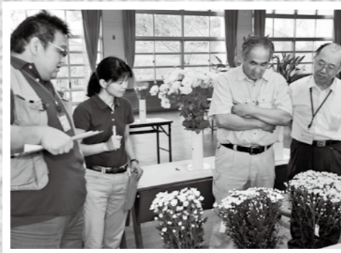
市フラワーコンテストが9月14日、福山活性化センターで行われ、金賞5点が表彰されました。