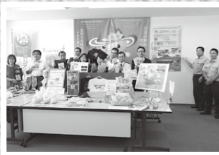
鹿児島県と宮崎県の7つの企業・団体がお菓子やTシャツなどの霧島ジオパーク商品を開発しました。