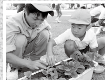
国分中央高校の出前講座が10月9日、牧園町三体小学校で開かれ、高校生が児童にイチゴ栽培の仕方を教えました。