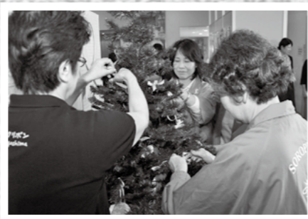
乳がんの早期発見と治療を訴えるために10月3日から2週間、市役所1階にピンクリボンツリーが設置されました。