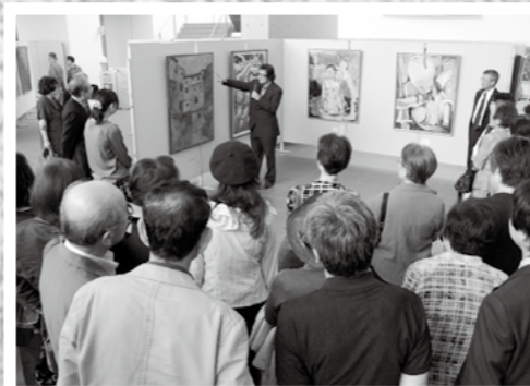
きりしま美術展の表彰式とトークショーが10月6日、国分シビックセンターで開かれました。