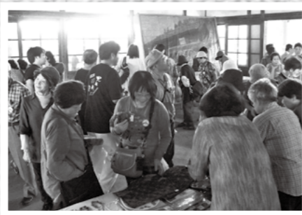
霧島山を列車で1周する環霧島周遊列車の旅が10月1日にあり、約150人が環霧島の魅力を体感しました。