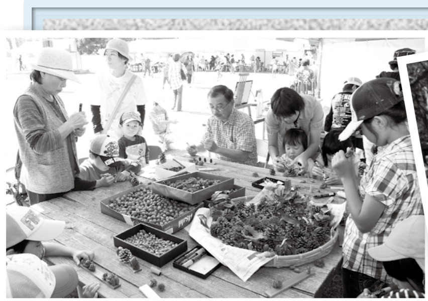
開園10周年を迎えた上野原縄文の森で秋まつりが10月13日、14日に開催され、縄文体験やヒーローショーなどでにぎわいました。