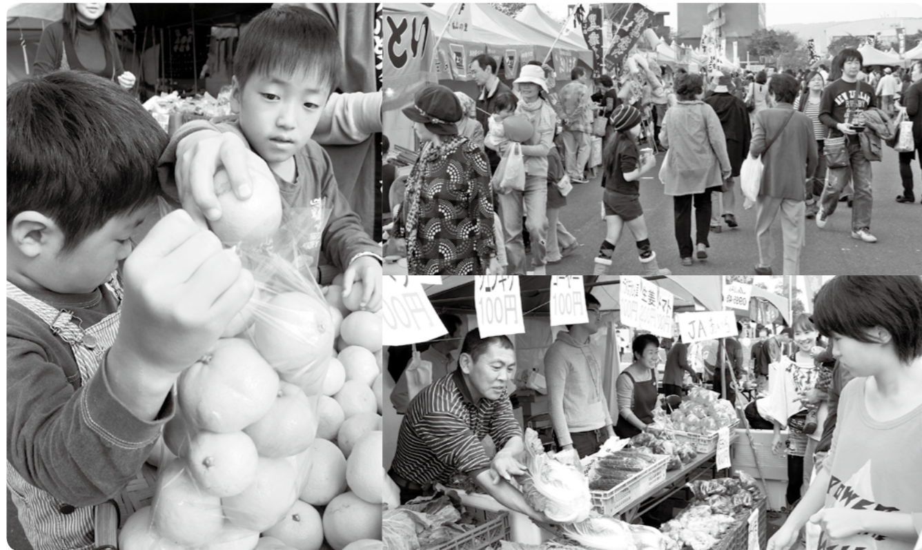
2年前に開催された霧島ふるさと祭