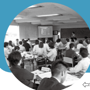
⇨学力向上に向けた市内の教職員の研修

県教育委員会では、県内の小・中学校の子どもたちの学力の定着度について把握し、今後の指導に生かすために、小学5年と中学1・2年の全児童生徒を対象に「基礎・基本」定着度調査を実施しています。昨年度は平成24年1月17日、18日に実施されました。