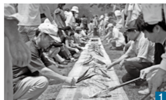
1 日当山のアユの塩焼き 2 国分の国分寺御輿競走