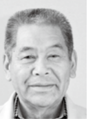
牧園地区 厚地 覺