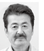
溝辺地区 西溜 丸美