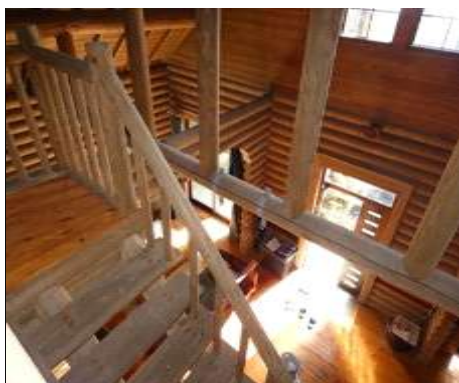
スキップフロアー