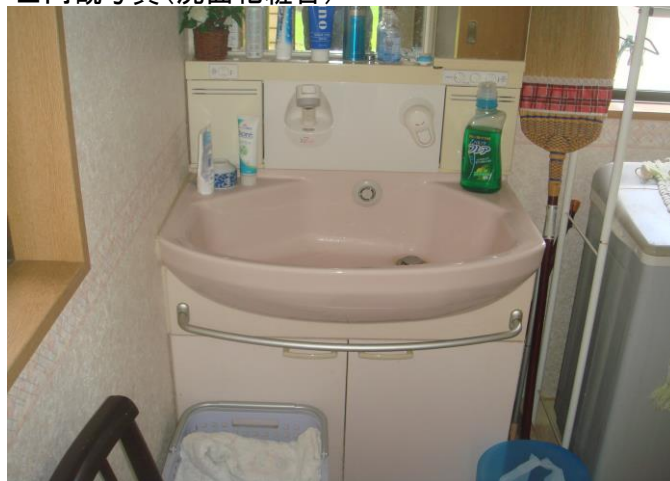
■内観写真(洗面化粧台)