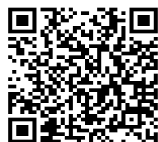
運動体操サロン参加申し込み

霧島市役所ホームページの「フレイル予防応援ページ」をご確認ください 運動体操サロンで行うストレッチ体操・整理体操を動画にしてアップしています