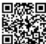
フレイル予防応援ページ