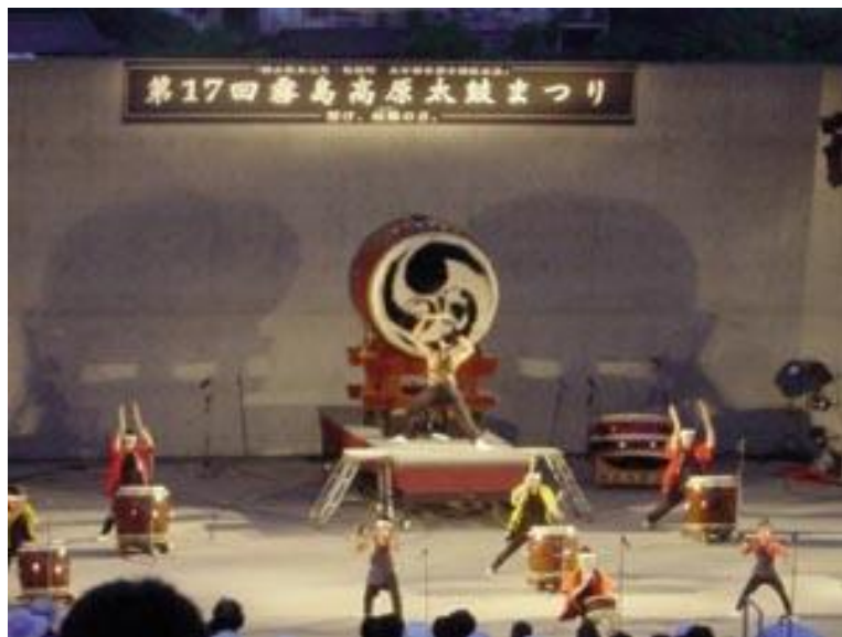
▲ 霧島高原太鼓祭りの演奏の様子 於：みやまコンセール野外音楽堂

いただき、霧島の活力と魅力を発信しようと始められました。主な出演は、霧島九面太鼓保存会や霧島神楽を中心として、霧島市内の芸能団体や県内外から招待した太鼓団体などで構成し開催します。神楽の幻想的な雰囲気と勇壮な太鼓の競演を是非ご覧ください。