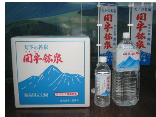
▲ ボックスタイプ(左)とペットボトル

「お世話になったあの方に・・・いつまでも健康であってほしい方に・・・」とあなたの感謝と願いを込めて、関平鉱泉水をお中元にぜひお使いください。なお、お中元用の「のし」も用意しておりますので、お気軽にお申しつけください。