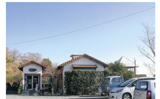
▲ 関平温泉本館 鉱泉所の営業時間外でも（午後8時まで）20ℓ・10ℓのご購入ができます。

関平温泉ではこれまでペットボトルの販売はしておりましたが、この度、温泉施設内に製品倉庫を新設しましたので、鉱泉所の営業時間外でも（午後8時まで）温泉の方で10リットル・20リットルをお買い求めいただけるようになりました。なお、大量にご購入される方は、鉱泉所（0120-235-524）へ事前に午後6時までに個数等のご連絡をお願いいたします。