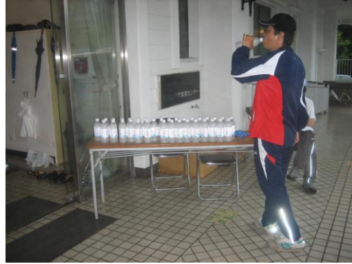
▲ スポーツを楽しんだあと関平鉱泉水を手にとり飲まれる参加者の様子。

平成 21 年 7 月 20 日（月）の海の日に、霧島市と観光姉妹都市である雲仙市の小浜町で子供から高齢者まで地域住民の健康保持と体力づくりを目的に開催された『生涯スポーツフェスタ in 雲仙』において、関平鉱泉水 500ml ペットボトルを提供いたしました。ウォーキングや軽スポーツを楽しまれたあと、参加者の皆さんは無料配布された関平鉱泉水を片手に「本当に温泉水ですか？とてもまろやかで飲みやすくおいしい。」と乾いた喉を潤していました。