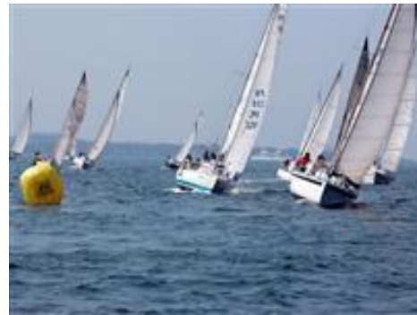
▲ 錦江湾を快走するヨットの様子。

鹿児島に夏の本格的な到来を告げるマリンスポーツの祭典「2009 鹿児島カップ火山めぐりヨットレース」が平成 21 年 7 月 15 日（水）～20 日（月）までの 6 日間開催されました。県内外から多数の参加があり、参加されたヨット愛好者の方々へ関平鉱泉水 500ml ペットボトル 1200 本を配布して関平鉱泉水を PR しました。