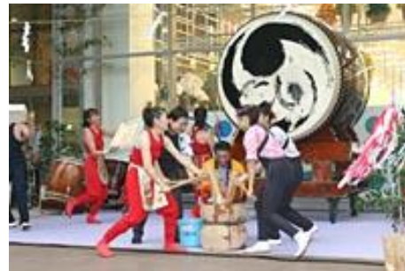
▲ 感響TheTAIKO霧島の様子 於：霧島市国分中央