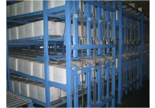
▲ 製品は冷蔵室兼自動倉庫で一日冷やされたのち出荷されます。

【お答え】 関平鉱泉水の 20L・10L は製品水 70℃でビニールバッグに充填されております。1 日冷蔵庫で冷やしてから販売、出荷しておりますが、夏場の時期は気温が高くなりますので、どうしても商品も冷えにくくなります。ご購入されたとき多少温かいとお感じになる場合がありますが、品質には問題ありませんのでご安心してお飲みください。