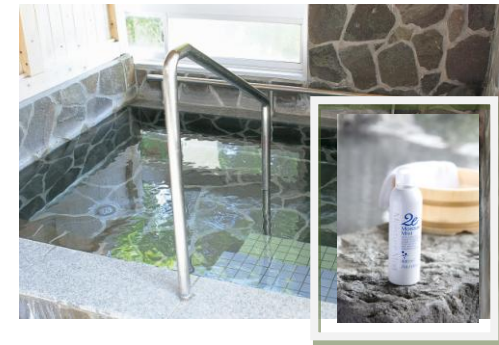
▲ 関平温泉浴槽と2e(ドゥーエ)保湿ミスト(右)