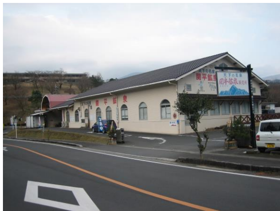
▲ 関平鉱泉所 2014.12.24

昨年中は、関平温泉・関平鉱泉をご愛顧頂き、感謝申し上げます。今年も格別のご厚情を賜りますようお願い申し上げます。関平温泉では今年も源泉100%掛け流しの快適入浴で、癒しの湯として皆様をお迎えいたします。また関平鉱泉所においても工場内の衛生管理を徹底し、さらに安心安全で高品質な商品を提供するよう取り組んで参ります。