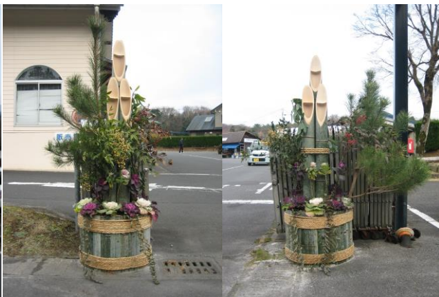
▲ 関平鉱泉所の門松 職員で製作しました！