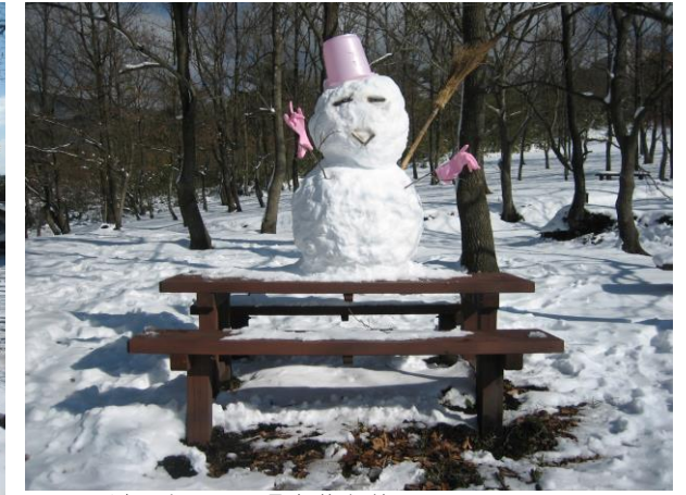
▲ 雪だるま 関平温泉遊歩道