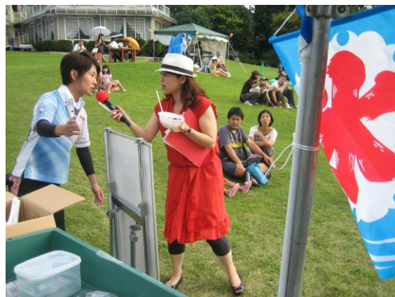
▲ 司会者にインタビューを受け、かき氷をプレゼント！温泉かき氷をPR！！