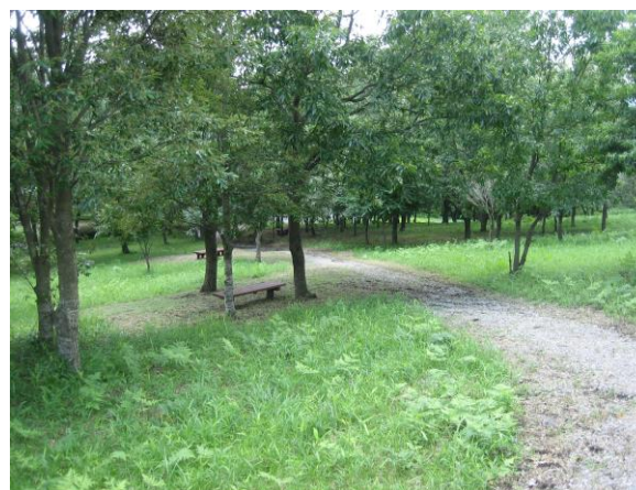
▲ 関平温泉の森 遊歩道 距離=往復約400m

関平温泉の森には、くつろぎとふれあいの空間として皆さんがお気軽に休憩していただけるよう、遊歩道とちょこっと休憩ができるテーブル&ベンチを設置しております。入浴のあと休憩やお弁当を食べたり利用する方も多く好評でしたのでこのたび、テーブル&ベンチを増設しました。