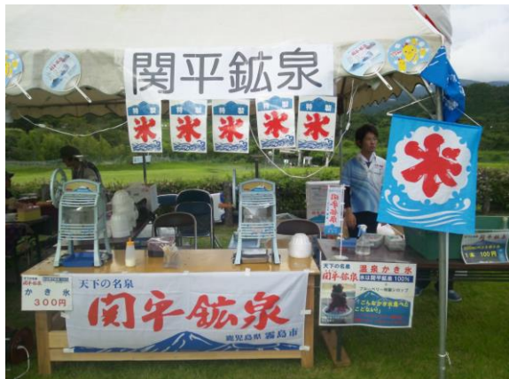
▲ こんな感じで販売しました！

「天孫降臨霧島祭」と「第4回霧島音泉♪の祭典」で今年も温泉かき氷を販売！！関平で作った氷と地元産のブルーベリーの果実の甘さが大好評でした。