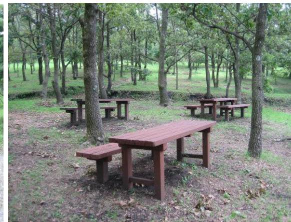
▲ 遊歩道入口のベンチ&テーブル 関平にお越しの際は森林浴を楽しんでください。