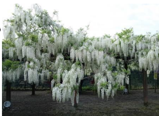
▲ 薄紫、紫、ピンク、白と色とりどりの花房が下がる藤棚は、幻想的な美しさです。

ナディアール® 050などのIP電話とPHSからはご利用いただけません 2次元コード対応携帯