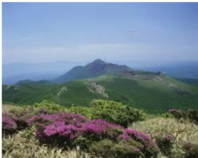
▲ 韓国岳より見た高千穂の峰（噴火前）火山れきに覆われ一時は全滅も危ぶまれましたが、ミヤマキリシマの群生も再生して花を咲かせています。

新緑の5月は心地いい風が吹きます。生まれたての黄緑色の若葉が、日々鮮やかな緑になり、この季節の植物の生命力には感心させられます。5月になると、霧島の上に自生する固有種で国の天然記念物の「ノカイドウ」が、白い花を枝いっぱい咲かせます。霧島では、この時期、「ノカイドウ」だけでなく「ミヤマキリシマ」など、平地では見ることのできない、いろいろな花を楽しむことができ、珍しい花たちを目当てに多くの登山客で賑わいます。