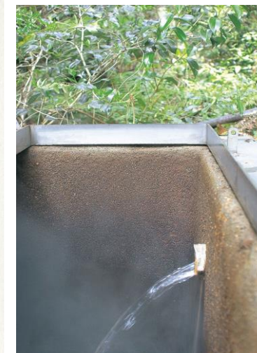
▲ 関平温泉 源泉

のために今年もいい水を届けたい」と話した。関平鉱泉は約180年前に発見。1976年から旧牧園町が販売し、市町合併後は霧島市営となった。2012年度の売上高は3億2400万円、純利益は約9千万円だった。 関平鉱泉源泉で恵みに感謝する職員ら 霧島市牧園