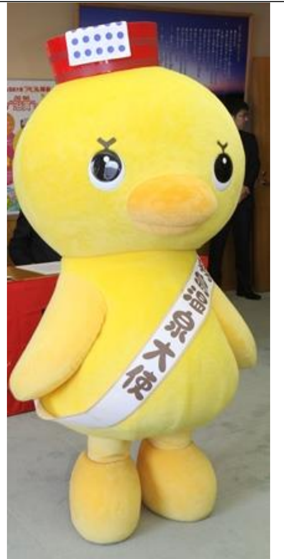
▲ 温泉大使に就任したアヒル隊長。頭の湯おけと手ぬぐいが特徴です。

霧島市には大小様々な温泉があり、温泉郷だけでも「霧島神宮温泉郷」「霧島温泉郷」「妙見・安楽温泉郷」「日当山温泉郷」の4つがあります。泉質も9種類と豊富で、温泉施設も大浴場に家族湯や露天風呂、貸切温泉に足湯などバラエティ豊か。日本で初めて国立公園に選ばれた地であり、坂本龍馬とお龍が新婚旅行をした事でも全国的に有名な歴史ある温泉郷です。年間を通じて多くの温泉観光客が訪れる霧島市。生活の中でも温泉は欠かせないものとなっています。