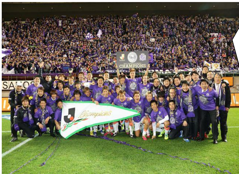
▲ 2013サッカーJ1 チャンピオン サンフレッチェ広島

スポーツチームにとって1月から3月にかけては、リーグ戦に向けて選手とチームのレベルアップを図る大切なキャンプシーズンであります。霧島市では、温暖な気候と交通アクセスの良さ、練習場や宿泊施設の充実などをPRしてキャンプ誘致を行っており、平成25年度（平成26年）の霧島市スポーツ団体春季キャンプが次の団体及び日程で行われる予定となっております。