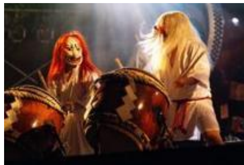
▲太鼓の音や舞は迫力満点。開演：20：30～ 無料

日時：平成25年2月22日(土)、3月29日(土) 場所：みやまコンセール お問い合わせ：(社)霧島市観光協会 電話番号：TEL：0995-78-2115