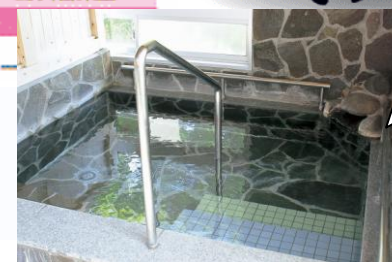
▲ 天下の名泉 関平温泉

ウォーキング+温泉 美しい自然を歩いたあとは、関平温泉に入って心も身体もリフレッシュ♪。