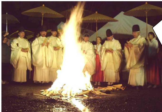
【天孫降臨御神火祭】

残暑が厳しい…と思っていたら、あっという間に寒さがやって来ましたね。刻々と深まる秋。紅葉スポットとしても有名な霧島も絶好の季節を迎えました。霧島の紅葉は例年10月下旬から11月下旬にかけて山々を綺麗に彩ります。そしてこの時期、霧島市ではいろいろな行事が行われます。自然の美しさを満喫していただくとともに、これらのイベントを満喫してください。