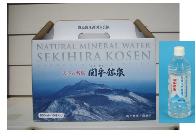
▲ 500mlペットボトル10本入り箱 ※ 持ち運びに便利な“取っ手付き”