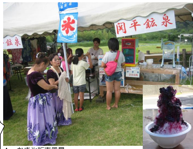
▲ かき氷販売風景 霧島の名物となるよう来年は、本格的に販売する予定です。

先月号でみやまコンセールで開催された天孫降臨霧島祭での関平鉱泉水のかき氷の販売のご報告をしましたが、9月7日、8日にまほろばの里で開催された「霧島音泉♪の祭典」でも関平鉱泉水のかき氷を販売、大盛況でした♪