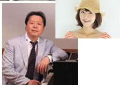
▲ 特別ゲストタケカワユキヒデさんと総合司会の武田みどりさん

10月27日(日) 13:00開演 (12:30開場) ＜会場/野外音楽堂＞※雨天の場合は主ホールにて開催 ◆総合司会/武田みどり ◆特別出演/タケカワユキヒデ「シンガーソングライター」 ◆出演/公募バンド、吹奏楽等 ＜全席自由＞ 一般/1,000円, 高校生以下/500円 お問い合わせ=みやまコンセール TEL (0995) 78-8000