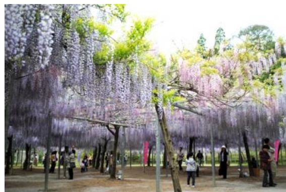
▲ 薄紫、紫、ピンク、白と色とりどりの花房が下がる藤棚は幻想的な美しさです。