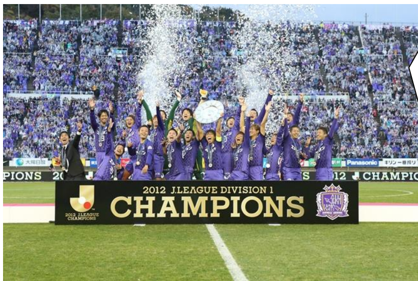
▲ 2012サッカーJ1チャンピオン サンフレッチェ広島

今年もスポーツチームのキャンプシーズンがやってきます。スポーツチームにとってこのキャンプは、新シーズンに向けてチームと選手のレベルアップを図る大切なものです。今年も多くのチームが活躍を目指して、霧島の地で躍動します。今年が目玉は、昨年、サッカーJ1を初制覇したサンフレッチェ広島です。