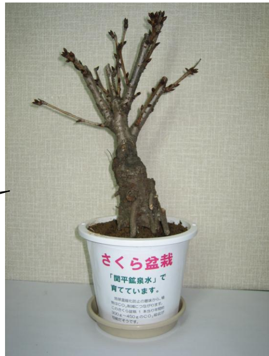
▲ さくら盆栽。(平成25年1月10日) ※ 関平鉱泉水で育てています。

1月のはじめ、イカリ消毒(株)様から環境活動の一環とのことで「さくら盆栽」を頂きました。このさくらの盆栽(右図)は、1本当たり年間約300g~450gのCO 2 の吸収が可能だそうです。私たちも地球環境に一役立ちとうと、「さくら盆栽」を育てることにしました。綺麗な花を咲かせてくれるのを楽しみに関平鉱泉水で育ててみます。