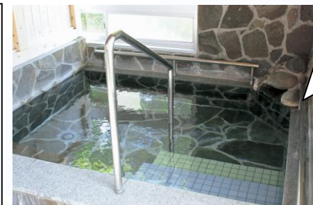
▲ 天下の名泉 関平温泉

社団法人 霧島市観光協会 龍馬ハネムーンウォーク実行委員会 TEL：0995-78-2115 FAX：0995-78-3487 受付時間：午前9時～午後5時