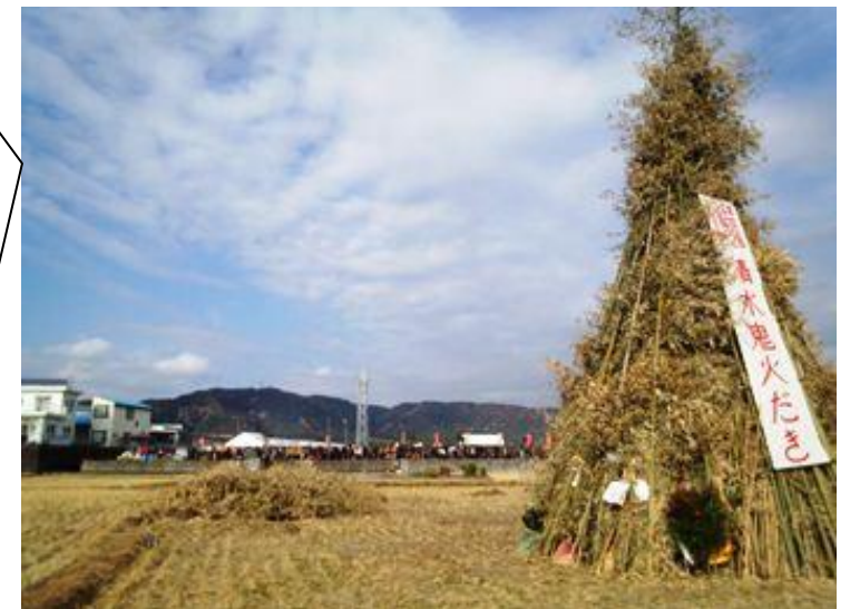
▲ 無病息災を願って鹿児島各地で見られる風景。巨大な竹のやぐらに正月飾りを投げ込み、厄を払います。残り火でもちなどを焼き、一年の健康をみんなで願います。