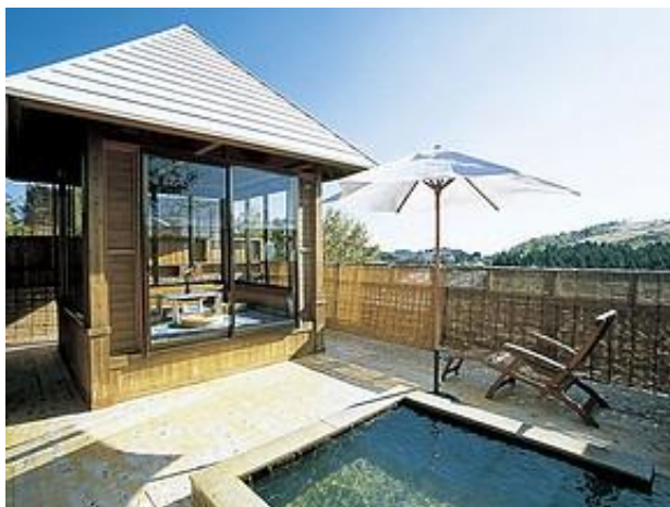
▲ 関平温泉 東屋を備えた貸切露天風呂 絶好のロケーションで気分爽快！ ※ 要予約

関平温泉は治癒療養、健康増進、心の癒しに180年前から湧き出る温泉の効果は広く認知されております。効能は神経痛、腰痛、五十肩、やけど、外傷、美肌など、飲んででは慢性消化器病に長年変わらぬ効果があります。湯に浸かり、人と自然を感じ、歴史を育む「関平温泉」。皆様のお越しを心からお待ちいたしております。