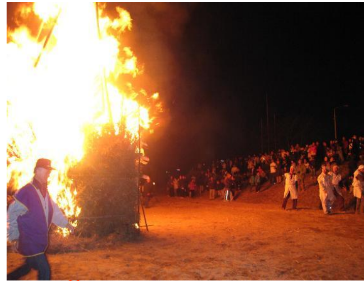
▲「パーン!!」と、竹が破裂する音で鬼が逃げていくそうです。

1月7日を過ぎると、霧島市の各地で無病息災を祈ってお正月に飾ったしめ縄や門松を燃やし、やぐらに火をつける「鬼火たき」が、地域の皆さんや子供たちが多数参加して行われます。点火とともに勢いよく炎が天まで届くかのように激しく燃え上がり、生竹がはじけるパンパンという鬼を追い払う大きな音に歓声も上がり、鬼火にあたりながら今年一年の無病息災を祈ります。