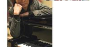
▲ 特別ゲスト=吉俣良さん

10月28日(日) 13:00開演 (12:30開場) ＜会場/野外音楽堂＞※雨天の場合は主ホールにて開催