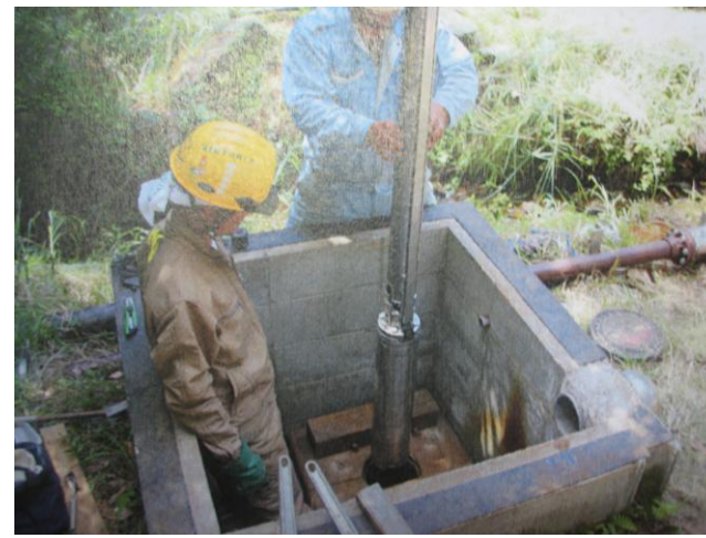
▲ 新床温泉源泉 ポンプメンテナンス風景

関平温泉では、関平・新床の両泉源から温泉水を供給し、2つの浴槽で皆様にご利用いただいております。