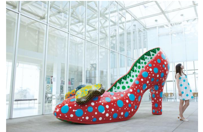
▲ 「鹿児島県アートの森」霧島連山の北にある栗野岳の中腹、標高700mの大自然の中に広がるスケールの大きな野外美術館。