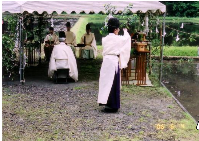
▲ 日本最古と伝えられる神田で早男・早乙女らによって早苗が植えられます。

過ごしやすい季節はあっという間に過ぎ、もうすぐ梅雨の季節がやってきます。霧島市では、この時期になると田んぼには水がはられ、あちらこちらで田植の風景が見られるようになります。今年も霧島神宮と鹿児島神宮で、五穀豊穡を祈願する「御田植祭」が奉納されます。