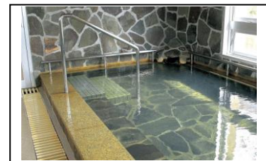
▲ 疲れが取れると評判の新床温泉