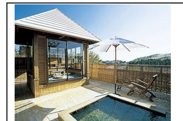
▲ リゾート気分満点の貸切露天風呂