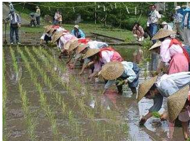
▲ 神田への田植え風景。40-50人が左右に分かれて手植えを行います。現在は田植機が普及し手植えの風景はめっきり見なくなりました。

日時：6月24日(日) 場所：鹿児島神宮 雨天決行・無料 お問い合わせ：鹿児島神宮 TEL：0995-42-0020