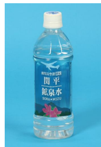
▲ 鹿児島空港限定 関平鉱泉 SORA*MIZU