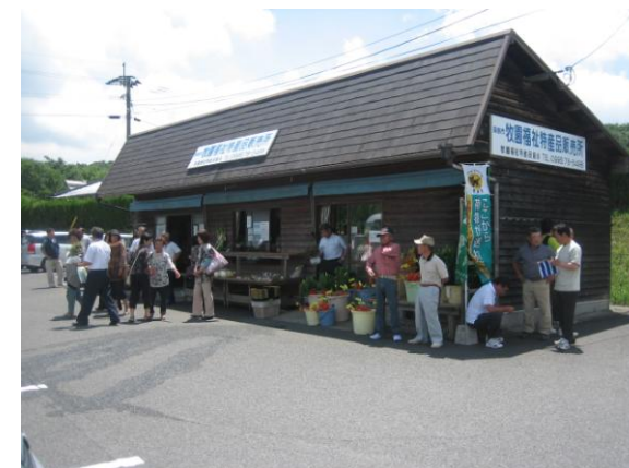
▲ ふれあいふくし市