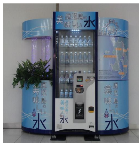
▲ 鹿児島空港1F 到着ロビーにある県内の名水を集めた自販機