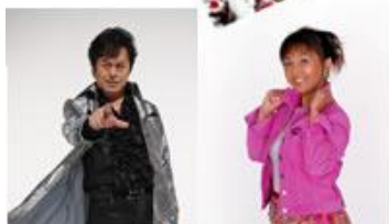
▲特別ゲスト＝水木一郎さん他