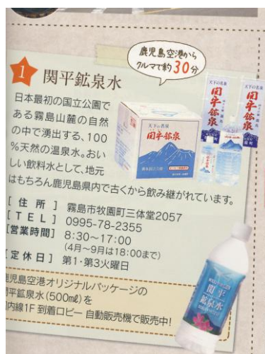
▲ Sora-Maga[ソラマガ] Vol.8 関平鉱泉の紹介

空港内や県内のホテル・旅館・観光施設などで配布される鹿児島空港内の買い物、グルメ情報などを掲載したフリー情報誌「Sora-Maga（ソラマガ）」で関平鉱泉水が紹介されました。鹿児島空港1F 到着ロビーには、県内の名水を集めた水だけの自販機があり、鹿児島空港限定『関平鉱泉 SORA*MIZU』が販売されています。鹿児島空港をご利用の際は、是非、一度飲んでみてください。