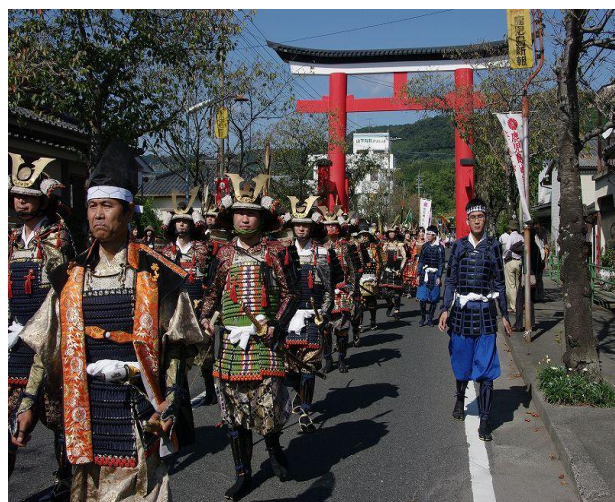
▲ 鹿児島神宮 境内を出発する武者行列。

暑かった夏がやっと過ぎて、秋の気配が感じられる今日この頃。霧島市では、10月16日(日)伝統行事「きりしま隼人浜下り」が開催されます。当日は、約400人の武者行列が、鹿児島神宮から隼人港近くの八幡屋敷までの約4・5キロを練り歩きます。8世紀前半に大和朝廷に制圧された豪族・隼