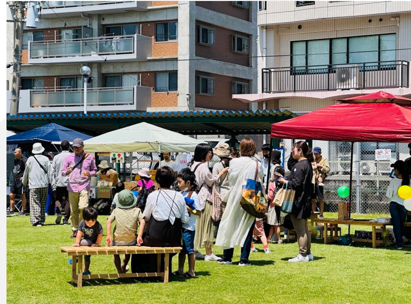
えんがわマルシェ (2023.4月,9月)