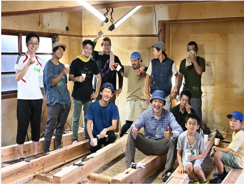
DIYサウナづくりワークショップ (2023.6~11月)