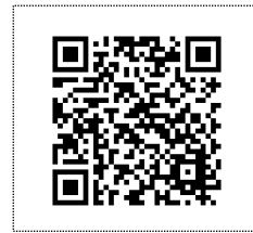
霧島市ホームページ