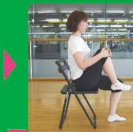
5 膝を胸に近づける