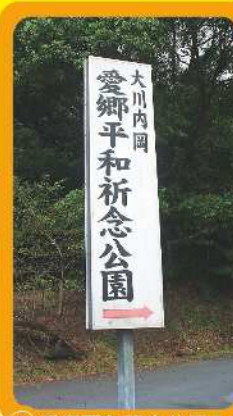
⑨愛郷平和記念公園入口