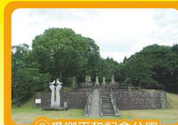
⑧愛郷平和記念公園