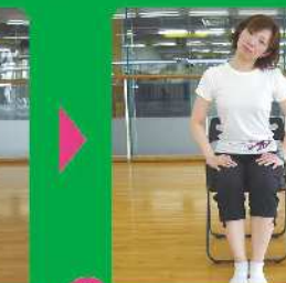
2 頭を左右に倒します