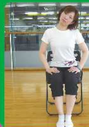
2 頭を左右に倒します