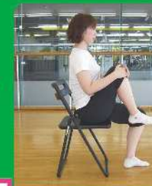
5 膝を胸に近づける