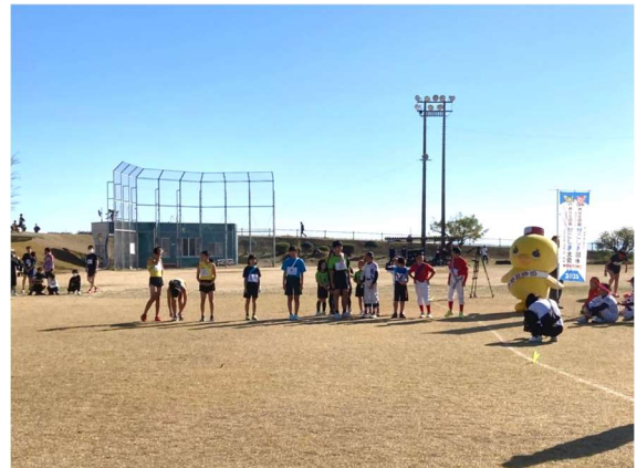
第25回溝辺地区駅伝競走大会国体PR