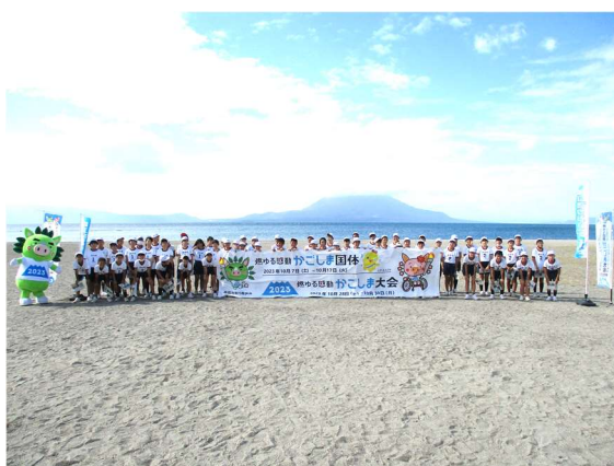
国分下井海岸（国分南小学校6年生）