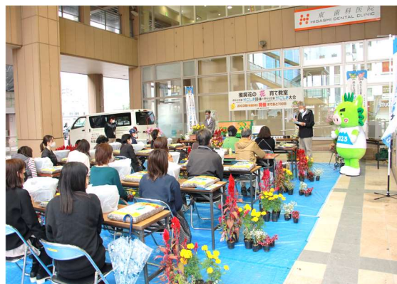
（市主催）推奨花の花育て教室