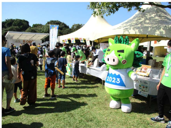
第18回縄文の森秋まつり国体PR