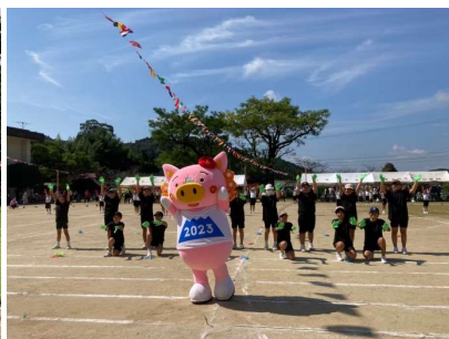
大田小学校運動会（霧島）