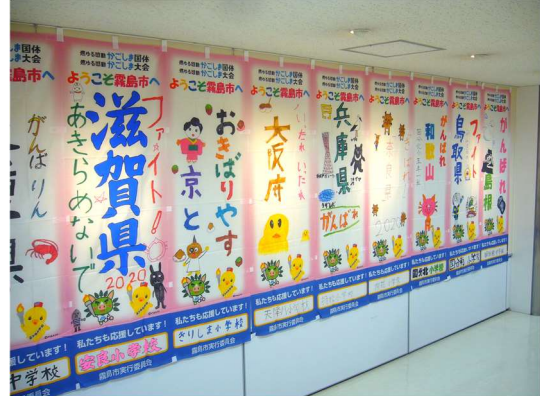
かごしま国体開催【600日前】イベント 鹿児島空港国内線ビル キャラリフレンドリー 手作り応援のぼり旗展示