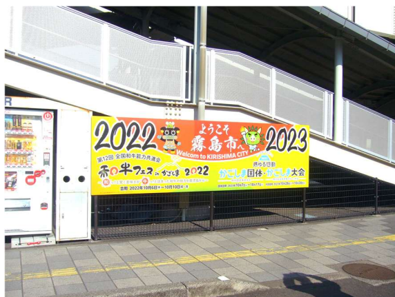
国分駅前国体PR看板