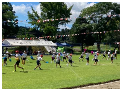
安良小学校運動会（横川）