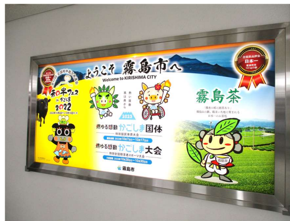
鹿児島空港電照看板