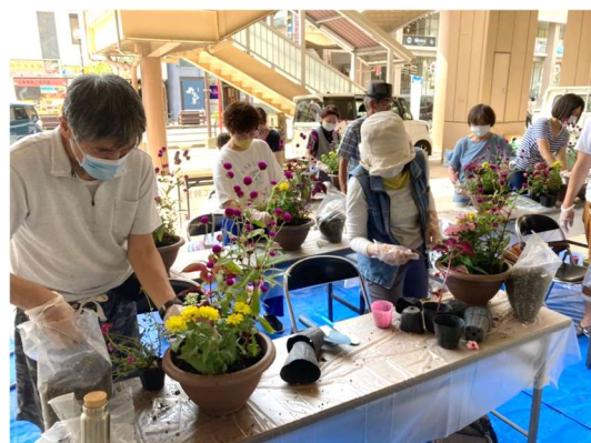
（県主催）花育て教室