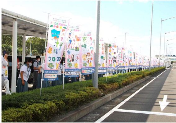
かごしま国体開催【2年前】記念 鹿児島空港前手作り応援のぼり旗設置