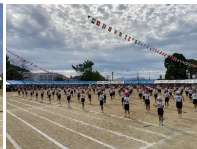
国分小学校運動会（国分）