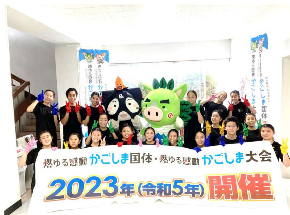
鹿児島レブナイズ公式試合 国分中央高校ダンス部国体ダンス披露