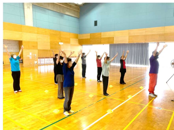
国体ダンス公民館講座