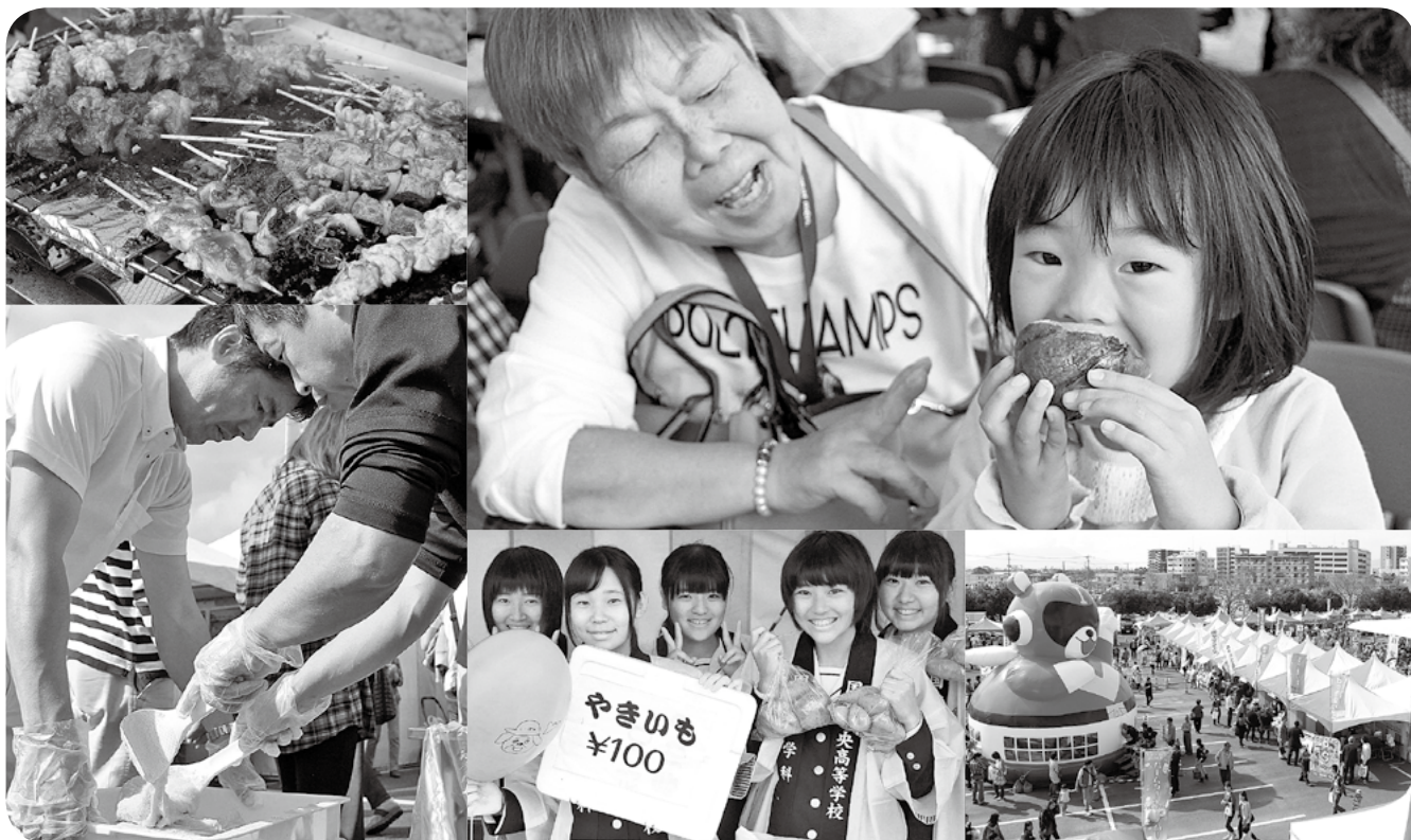
「おいしい」があふれ、にぎわう会場