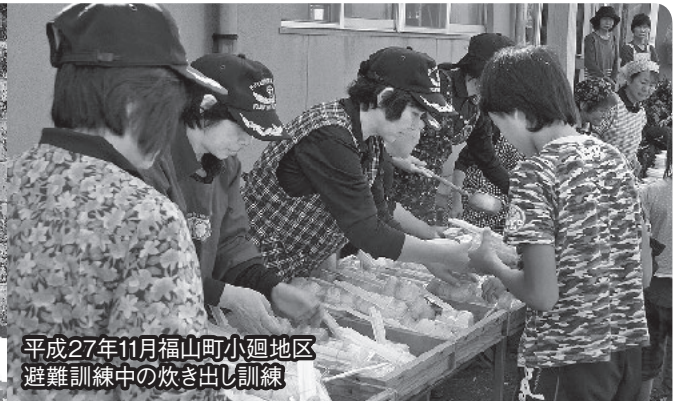
平成27年11月福山町小廻地区避難訓練中の炊き出し訓練