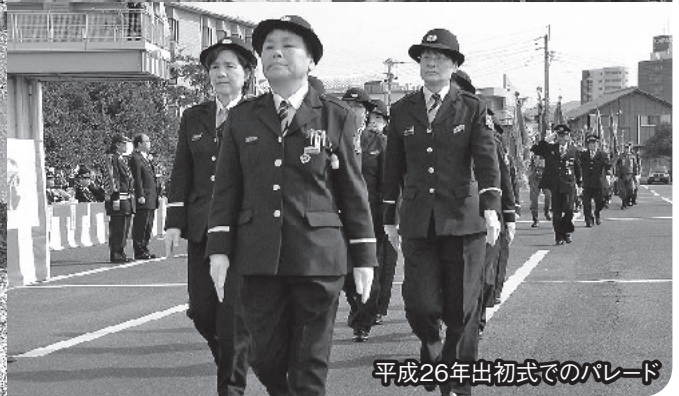
平成26年出初式でのパレード