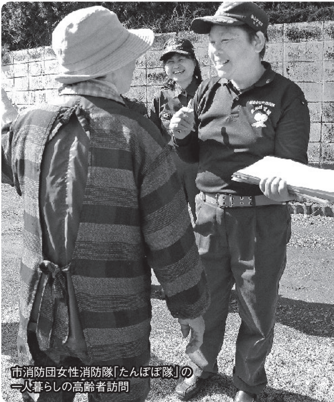
市消防団女性消防隊「たんぼぼ隊」の一人暮らしの高齢者訪問