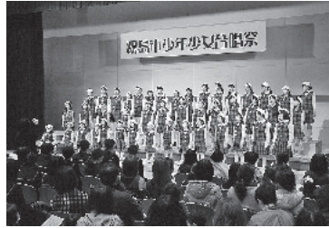
昨年の少年少女合唱祭でステージに立つ子どもたち