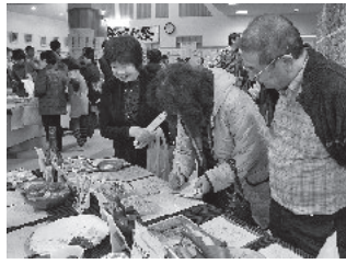
たくさんの家庭料理や郷土料理のレシピを熱心にメモする参加者たち

家庭料理大集合をはじめ、ばあちゃん直伝レシピ、食べもの絵手紙、箸使いワークショップ、アレルギーに関する展示、霧島の食と農の体験コーナーなど、盛りだくさんの内容です。