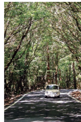
高千穂河原入り口 樹帯 8月8日 午前10時25分

※読者プレゼントを提供して下さる方を募集しています。秘書広報課広報広聴グループ ☎(64)0955 までご連絡ください。