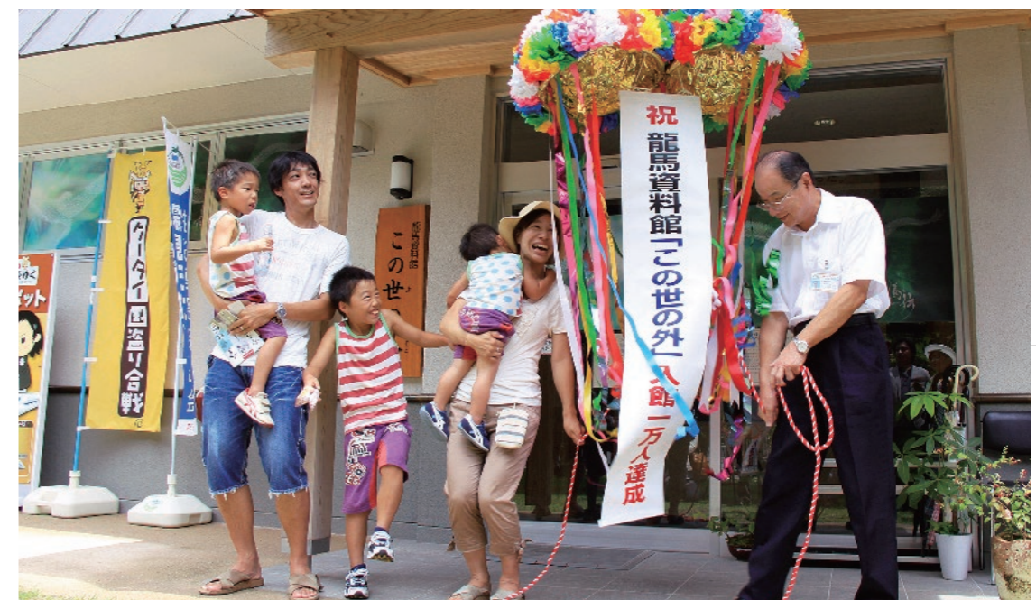
今年5月1日にオープンした塩浸温泉龍馬公園。8月18日には入園者が10万人を突破。この日は園内の資料館「この世の外」も入館1万人を達成。大河ドラマ龍馬伝放送とともに霧島の観光ルートの目玉となっています。秋の行楽シーズンを控え、新たな観光ツアーや全国に向けた観光PRの拠点として期待されます。

して入園者10万人を突破しました。観光地としての魅力にあふれ、話題も豊富な昨今、