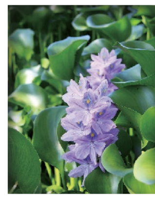
ホテアアオイ(布袋葵) ミズアオイ