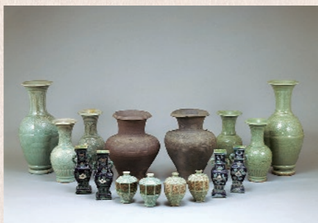
鹿児島県指定文化財(工芸品) 鹿児島神宮所蔵陶磁器 平成22年4月23日指定