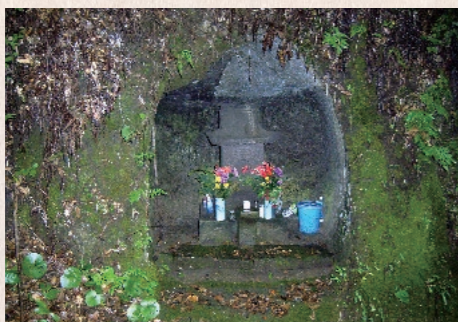
霧島市指定文化財(史跡) 乗林寺深亮房覺遍の墓 平成22年6月22日指定