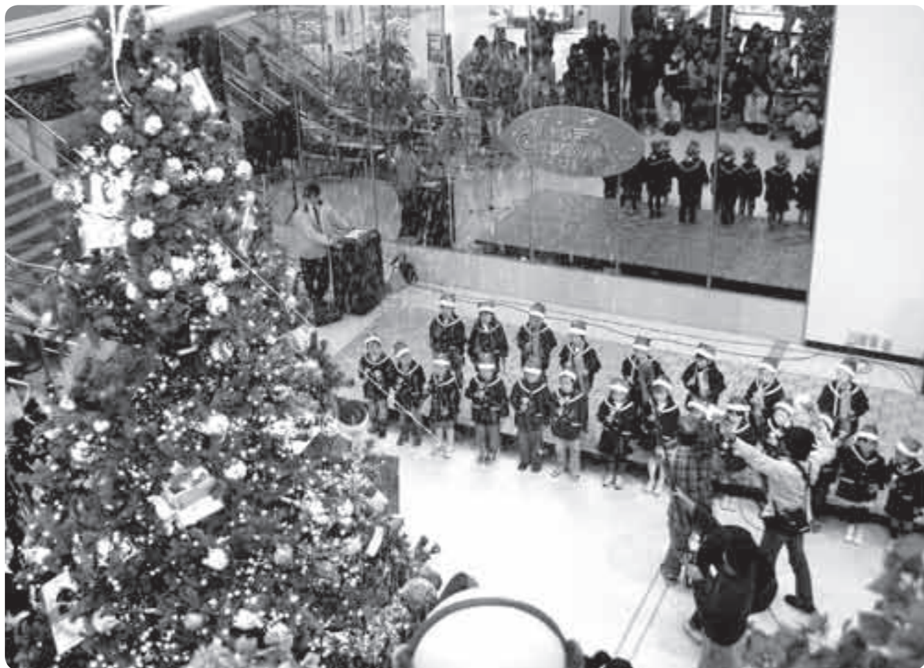
昨年のイルミネーション点灯式の様子。人工雪も降り、一足早いクリスマス