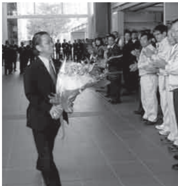
職員に拍手で迎えられる前田市長