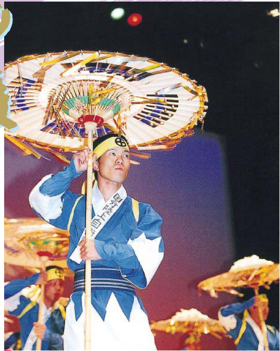
郷土芸能「薩摩傘おどり」

3月11日、「第43回市民と自衛隊のつどい」が霧島市民会館で開催されました。国分では42年間行われてきたこのつどい、今年も自衛隊員や市民などが舞踊や寸劇、郷土芸能などを披露し、リハーサルも合わせて約2,500人の来場者で賑わいました。