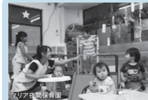
マリア夜間保育園