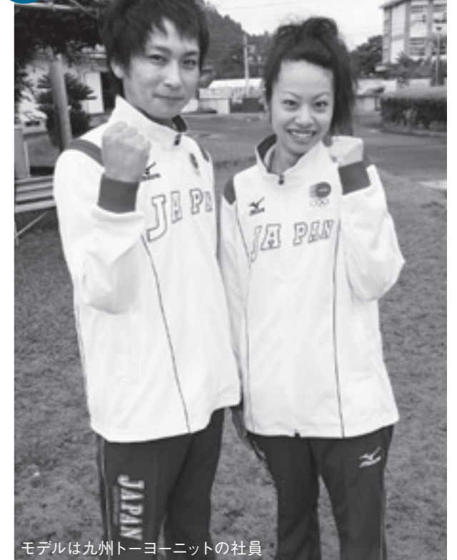
モデルは九州トヨーニットの社員

北京オリンピック日本代表選手の公式ジャージや陸上用ウェアなどはスポーツメーカーミズノの製品で、横川町にある九州トヨーニット(株)で作られています。同社は長年スポーツウェアを作っており、その経験と実績は高い評価を受けています。同社の皆さんは、「私たちが作った製品を着て選手たちが活躍してくれればとてもうれしいです」と話していました。