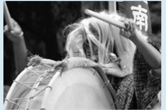
大太鼓踊り(南方神社大祭)