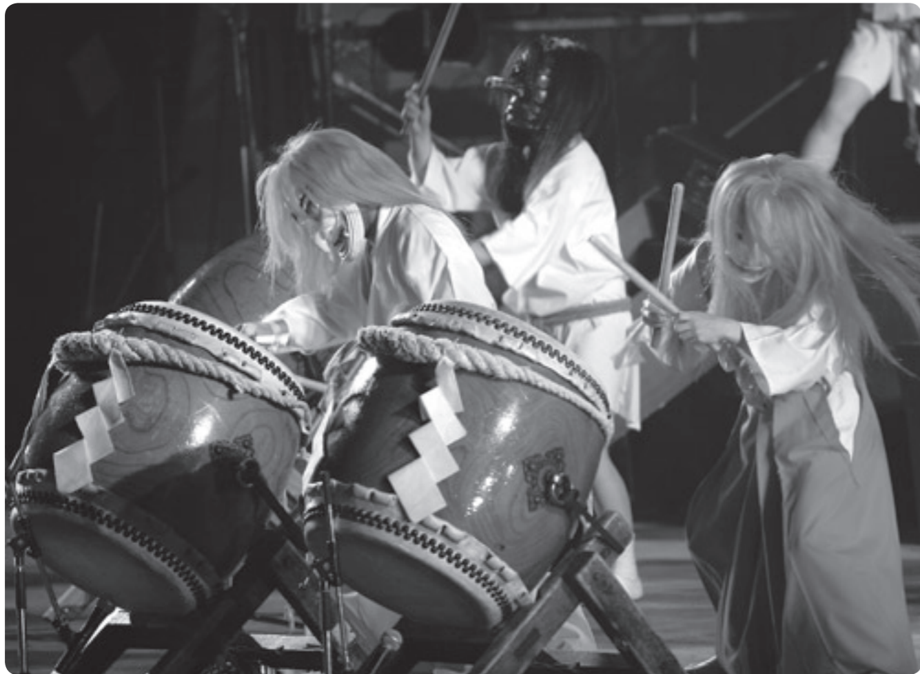
平成19年の霧島高原太鼓まつり