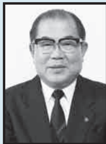
霧島市名誉市民 元国分市長 谷口 義一氏 死去