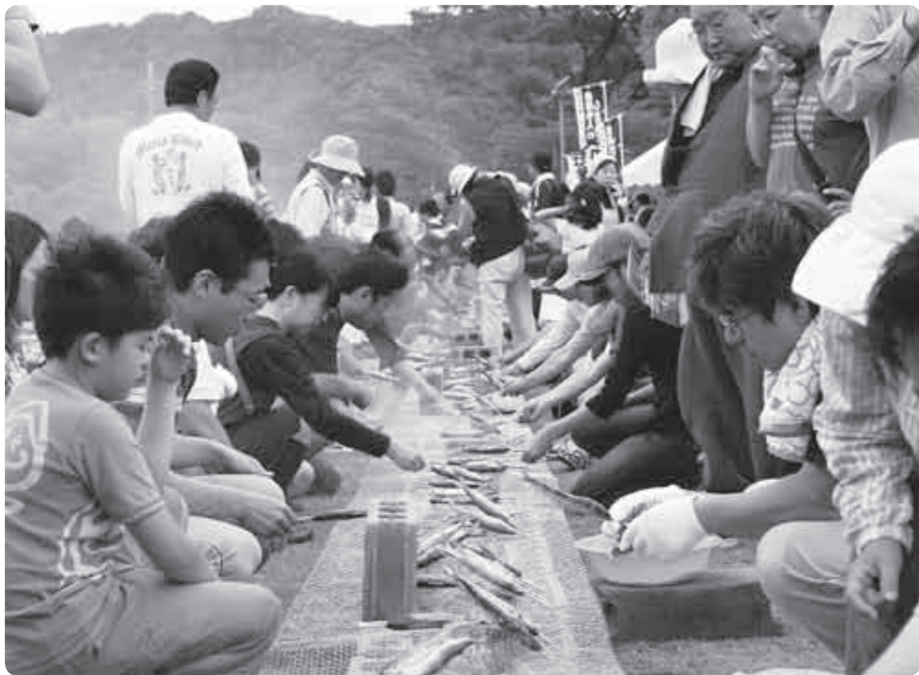
鮎の塩焼きコーナーは大人気(写真は昨年の鮎まつり)