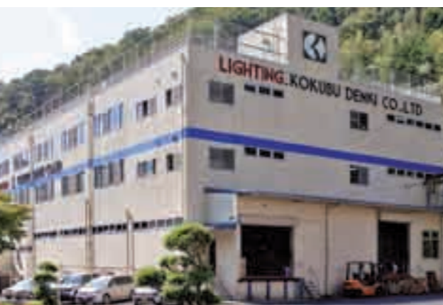
国分電機(株)本社工場

元気な企業がたくさんある霧 島市。 「良いモノを作りたい」とい う人たちの熱い思いが会社を元 気にし、その元気が霧島市の大 きな活力になっています。市で は、これからも元気な企業を応 援します。