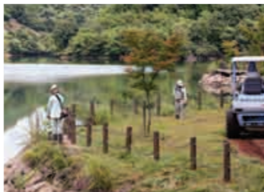
竹山ダムの水辺の除草をする参加者ら

十三塚原の農業は竹山ダムから運ばれる水によって大きく発展しました。その恩恵に感謝するとともに、東屋などが整備された水辺を美しく保つことを目的として実施され、それぞれの団体から約50人が参加し、草刈りやゴミ拾いをしました。また、水を浄化するEM菌が入った泥のボカシ団子を投入したり、講師を招き水や環境について意見交換をしたりと、身近な環境について学習しました。