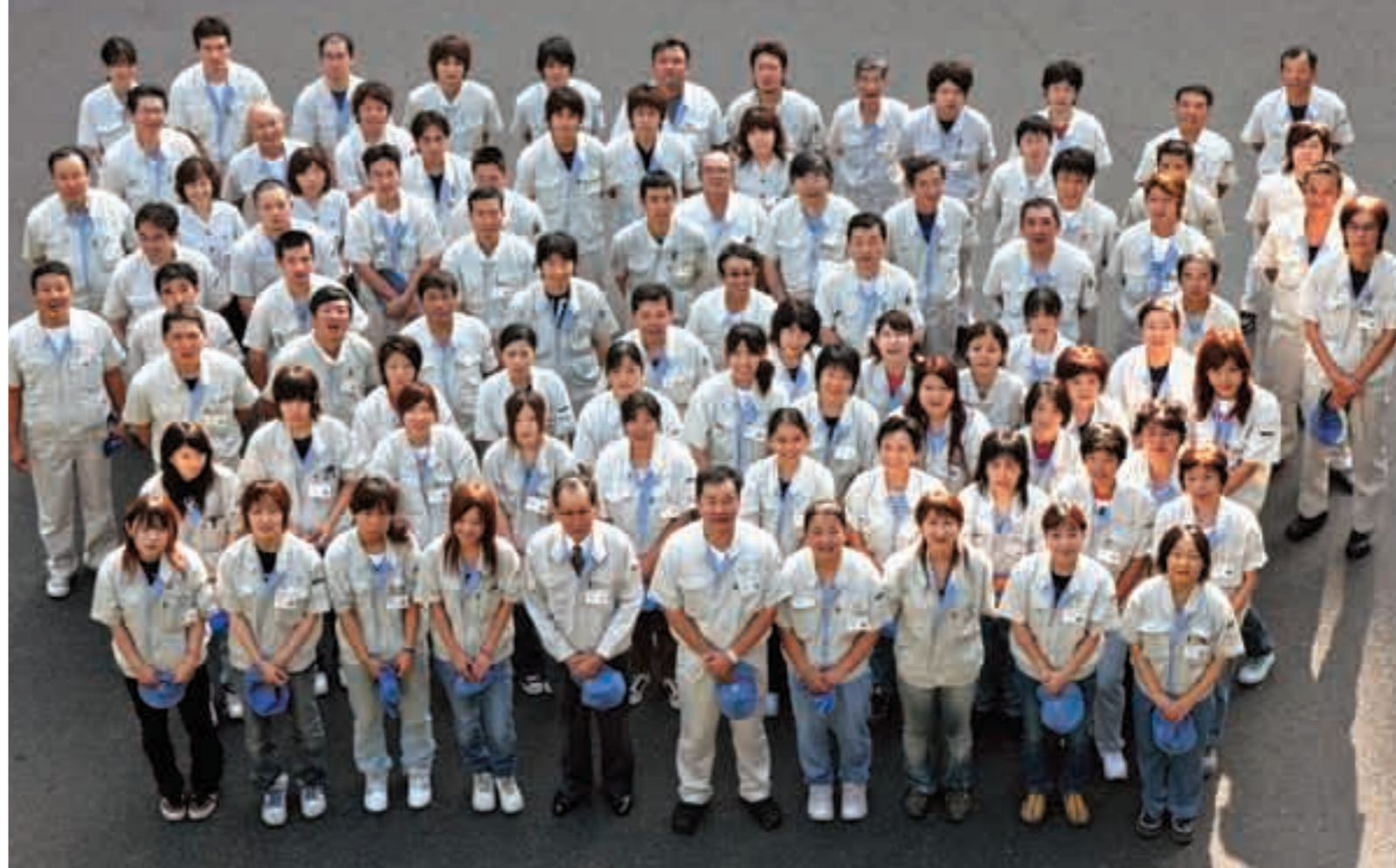
国分電機(株)本社の皆さん