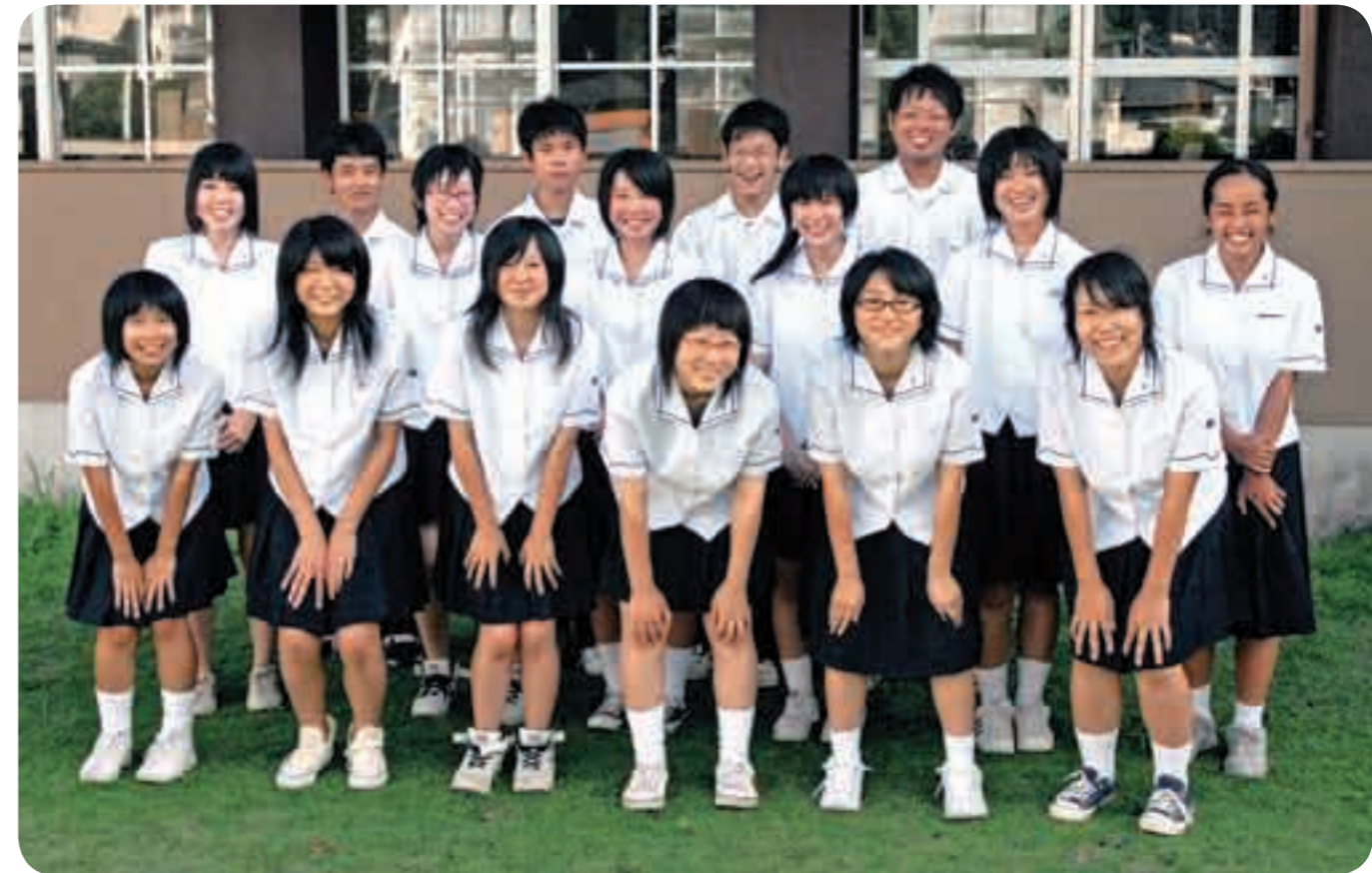
全国に上位入賞者を輩出する美術部

隼人工業高等学校は、霧島市で唯一の工業系の高校で、昭和23年に創立され今年59周年を迎えました。現在インテリア科114人、電子機械科231人、情報技術科118人の463人(男子381人、女子82人)が学んでいます。