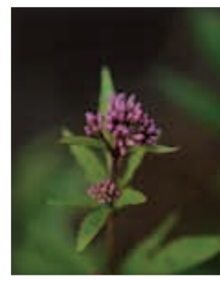
フジバカマ(キク科)