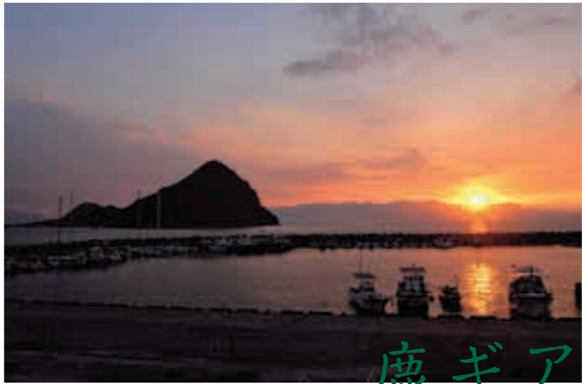
今まさに日が沈もうとしている単人新港