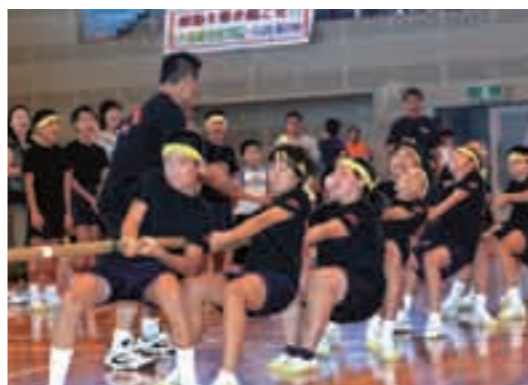
力を振り絞り綱を引く子どもたち

子どもたちに誘惑に負けない勇氣と強い意思を育んでもらおうと実施されたもので、霧島市からは横川町の安良小学校、横川小学校、牧園町の高千穂小学校の3校がチームを編成し出場しました。子どもたちは一人ひとりが持つ力を発揮し、チーム一丸となって真剣に取り組みました。その結果、横川小学校6年生のチームが優勝しました。