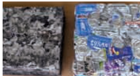
左は敷根清掃センターの焼却炉から出たアルミ。右は天降川リサイクルセンターに資源ごみとして集められたアルミ。