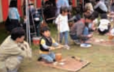
縄文文化を体験することができます

出土品がなぜ、何年前のものか分るのでしょいか。それには火山との関係があります。鹿児島島のシラス台地には、たさんの火山灰層があり、それぞれの層の年代が分かっているため、その上下から出土する遺物などの年代も分かるのです。土器を見ると火山との興味深いつながりが見えてきます。約6、300年前のアカホヤ火山の大噴火は想