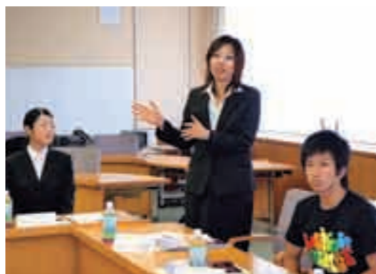
市長に自分の思いを伝える参加者

8月30日には若者の意見を聞くために「大学生等と市長と語りもんそ会」が開かれました。参加したのは市内の大学や短大、高専の代表者12人。参加者からは「若者が遊べる場所が無いので、映画館などを造ってほしい」「夜、明かりが無い道があるので防犯灯などを設置して防犯の強化をしてほしい」「便利だけを求めず、田舎の良さを生かした政策をしてほしい」など、若者の視点から活発な意見が出されました。