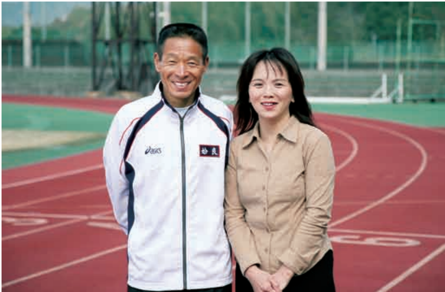
3月8日 国分運動公園にて

Kirishima City Public Relations, Japan 2007.3 VOL.30