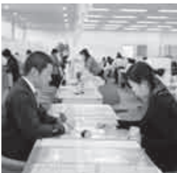
どの書きかたのお手伝いをするフロアマネージャーを本庁舎（国分）に配置します。

市民サービスセンターの設置・フロアマネージャーの配置 子育て支援業務や高齢者に対する相談などを行うとともに、年末年始を除く毎日、税などの取納、証明書などの発行を行う（仮称）市民サービスセンターを（仮称）国分駐車場複合ビル（旧山形屋跡地）に設置します。また、市役所を訪れたかたの窓口へのご案内や、申請書類な