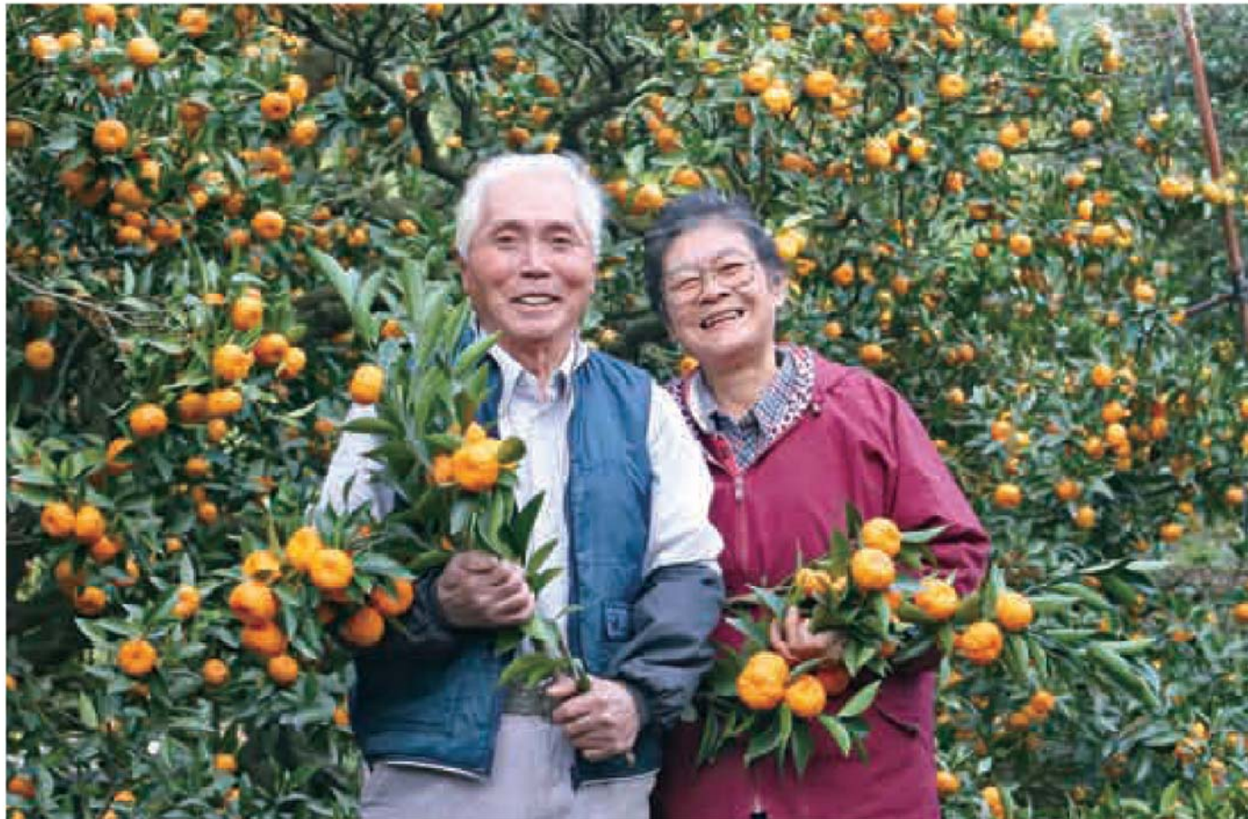
12月5日 自宅隣りのみかん畑(福山町福山)にて

Kirishima City Public Relations, Japan 2006.12 VOL.25