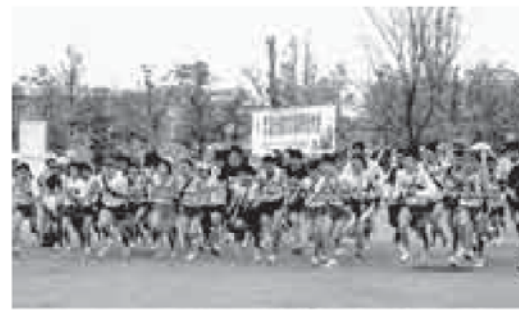
例年2,000人のランナーが集まる

・期日 3月11日(日) ※雨天決行 ・会場 上野原縄文の森祭りの広場 ○ジョギングの部 ・距離 3km ・参加料 一般2,000円 中学生以下1,000円 ○駅伝の部