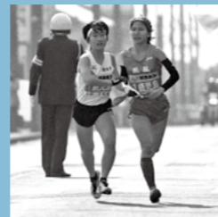
たすきに思いを込め、新春の霧島路を駆け抜ける選手たち