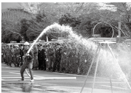
ポンプ操作を披露する消防団員

市中パレードや各方面隊による規律訓練、ポンプ操作などの披露があります。 ●日時 11月6日(火)午後0時20分から ●場所 霧島市役所周辺、霧島市民会館、お祭り広場 ●パレード 1 お祭り広場 ↓ パークプラザ左折 ↓ ライフガーデン 国分左折 ↓ 国分駅前左折 ↓ お祭り広場 ※パレード中は交通規制あり ●式典 11月6日終了後(雨天時は午後1時から市民会館での式典のみ)