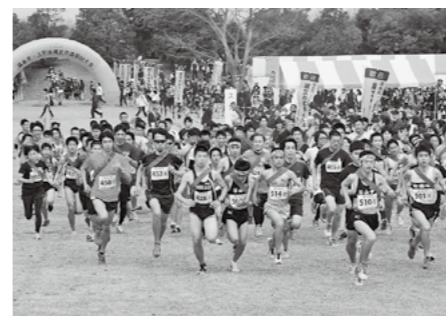
一斉に走り出すランナーたち

■新春イベント みんなで歩こう・走ろう会 ●日時 1月12日(月・祝) 午前10時～正午 ●場所 横川運動公園ジョギングコース ●参加費 無料 ●受付 12月25日(木)から ◎ 問 横川運動公園 ☎(72)0619