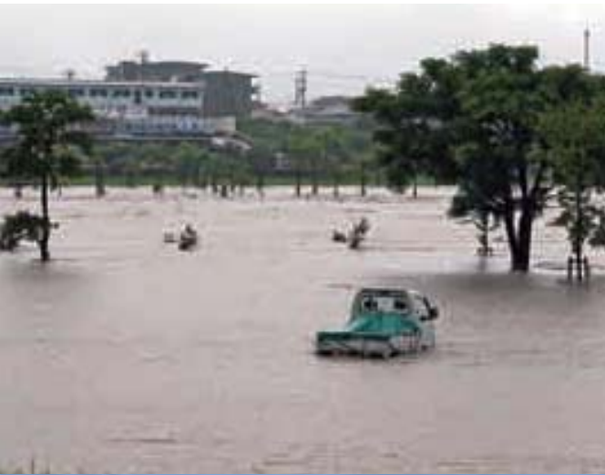
大雨で増水した降川が危険な状態に

鹿児島県各地に被害をもたらした2つの豪雨。霧島市も例外ではなく、大きな被害を受けました。6月24日には市内各地で午前5時ごろから午後9時ごろにかけて豪雨に遭い、牧園地区では時間最大雨量84mmの猛烈な雨が降り、最も少なかつた福山地区でも40mmの激しい雨を記録しました。この雨で天降川（東郷観測所）の水位が午前9時に警戒水位の8mを超えて8・51mまで水位が上がりました。被害額は市内で約1億7千万円に達し、特に農業関係に大きな被害が出ました。