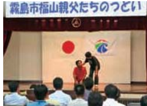
インプロ（即興演劇）を使って体験学習

9月12日、福山公民館で「第1回霧島市福山親父たちのつどい」が開催され、現在の教育問題について学びました。このつどいは親教育の一環として、コミュニケーション不足から生じるといわれる問題を解決するために実施され、幼稚園から高校生を持つ保護者を対象に、子どもとのコミュニケーション能力を高める方法をインプロという即興演劇を使って学習しました。演劇の中では、子どもの情報を確実にとらえた上で、親の情報を正確に伝える「YES☆AND方法」をゲーム感覚で体験し、楽しい研修となりました。