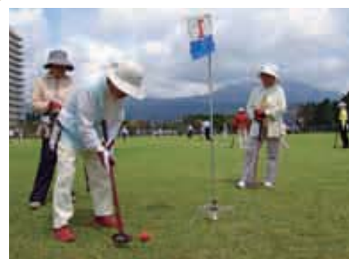
霧島連山の景観を楽しみながら競技をする参加者ら

9月12、13日、霧島ロイヤルホテルにおいて、グラウンドゴルフの普及および拡大と、中高年の健康増進を目的とした「第5回霧島さんるくグラウンドゴルフ大会」が開催されました。県内外から集まった364人の参加者らは、霧島連山を望む4ラウンド32ホールで打数を競い合い、心地よい汗を流しました。ホールインワンも数多く飛び出し、会場のいたるところで歓声が上がっていました。競技終了後は、宿泊券や特産品が当たるお楽しみ抽選会もあり、参加者らは「また来年も参加したい」と満足そうに話していました。