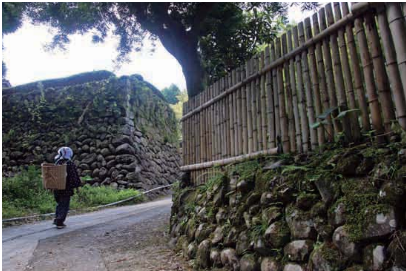
9月27日 10時33分 横川町山ヶ野

Kirishima City Public Relations, Japan 2006.10 VOL.20 霧 広報きりしま 島