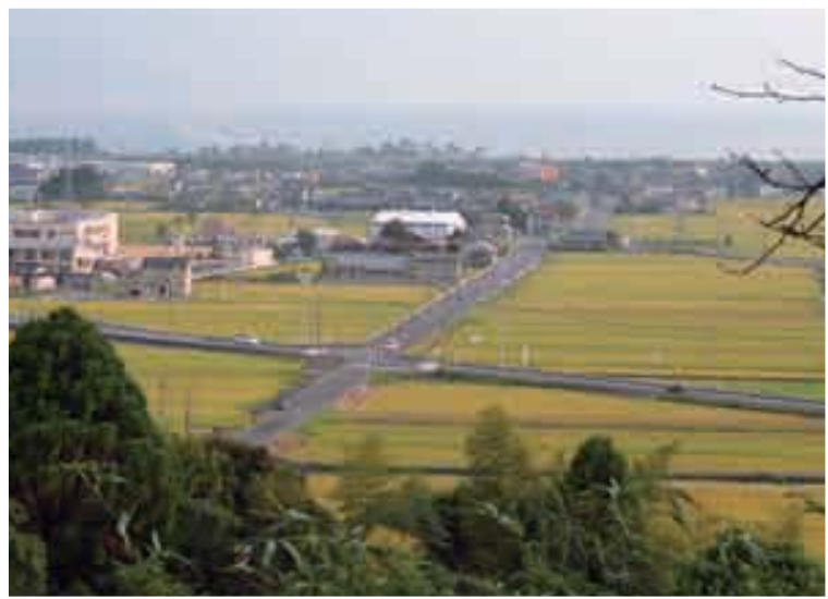
お平様が上井城から潮くみに通った道が海へと延びる

さら地にしてある国分上井の 傾斜地崩落対策事業で整備され ることになり、先日、状況を見 に行った。標高約1311の山 上にあった上井城跡の麓で、周 りに民家が帯状に張り付いてい る。子どもたちはこの小高い 山を「おえんしろ（上井城）」と