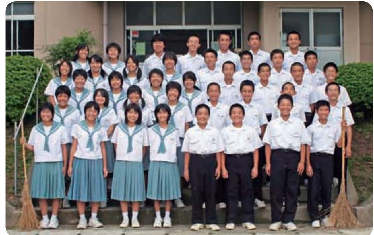
団結力なら負けない全校生徒40人みんな仲良し

福山地区の福山港を見下ろす高台に昭和22年に創立された福山中学校があります。自分で考えて行動するようにと授業などの始まりや終わりのチャイムが鳴らない福山中は、現在1年生8人、2年生18人、3年生14人の40人(男22人、女18人)。 生徒会で決めた学校自慢づくりスローガンは「さわやかあいさつ、きれいな学校、心はまんまる福山中」。生徒会活動が盛んで、昨年度は地域の人にも協力をもらい、3年がかりで空き缶を集め、リサイクル業者に買い取ってもらったお金で車椅子を買い、老人福祉施設に寄贈。今年度も地域のみんなが喜んでくれることをしようと幼稚園の子どもたちに手作りクッキーを焼いたり、お年寄りを招いてグラウンドゴルフをしたり港や公園の掃除をしたりしています。 じっくり座って自問する 自分で考え、自分で行動できる主体性を持った人間育成のための一つの手段として、福山中では「自問清掃」に今年度から本格的に取り組み始めました。「なぜ掃除をするのか」「どんな掃除をするのか」を考えた行動に移す。心の準備ができて