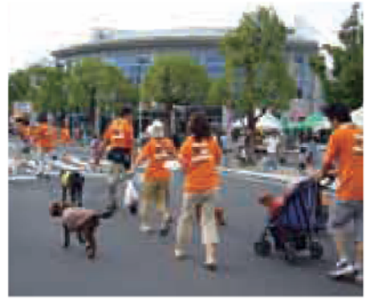
霧島市内の愛犬家たちが結成した「きりしまワンコ隊」、連携して愛犬と一緒に犯罪防止を目指して地域内をパトロールしています。

市内の防犯パトロール隊第一号は、まちづくり舞鶴隊です。「地域の安全のために役に立ちたい」と思った第一工大生の有志が集まり結成された舞鶴隊。霧島警察署と協力して夜間パトロールをしています。自治公民館組織として最初に発足したのは単人町姫城の姫城パトロール隊です。30代から70代までの方が活動して55人の隊員が3班に分かれ見回りをしていきます。そのおかげで最近では犯罪件数が減少。今では、地域の方とも連携をとり地域全体で防犯に努めています。