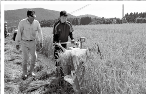
10月12日、霧島桂内地区が健康生きがいがづくり推進モデル事業の一環として稲刈りを行い、地域住民ら約30人が参加しました。