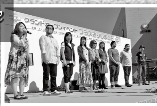
F Mきりしまの開局とプラスきりしまカードの誕生を記念して10月12日、市民会館前広場でグランドオープンイベント「プラスきりしまの日」がありました。