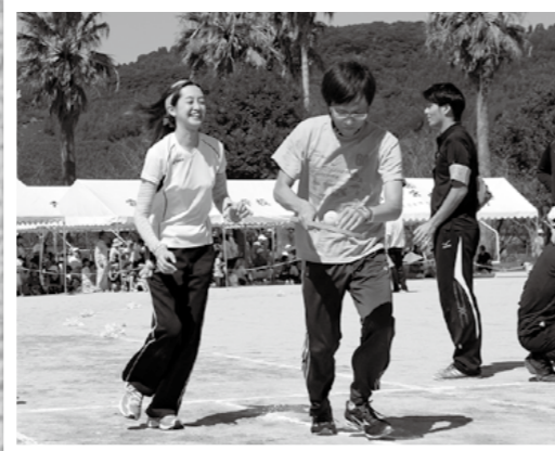
第48回健康づくり隼人生涯スポーツ祭が10月13日、秋晴れの下、隼人運動場で開催され中福良地区が優勝しました。