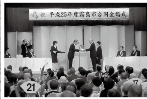
霧島市合同金婚式が10月7日、霧島ロイヤルホテルで開かれ、結婚50年目を迎えた115組の夫婦が参加しました。

福島創年老人クラブが、全国老人クラブ大会で優良老人クラブに表彰され、その報告に市役所を訪れました。➡