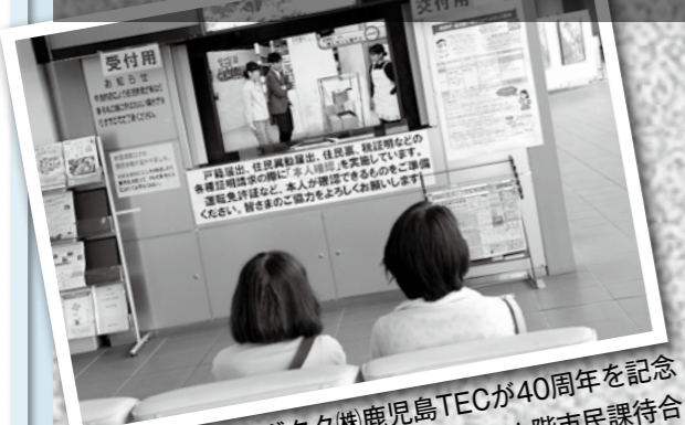
ソニーセミコンダクタ株式会社(株)鹿児島TECが40周年を記念して、市にテレビを寄贈。1階市民課待合所に設置しています。