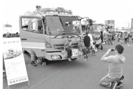
会場には消防車や自衛隊の車両などが並びます

対象者には11月中旬に、はがきで案内します。 現在本市に住民登録のない出身者や登録地区以外の式典に参加を希望される方は、12月13日(金)までに参加希望地区の担当課にお問い合わせください。