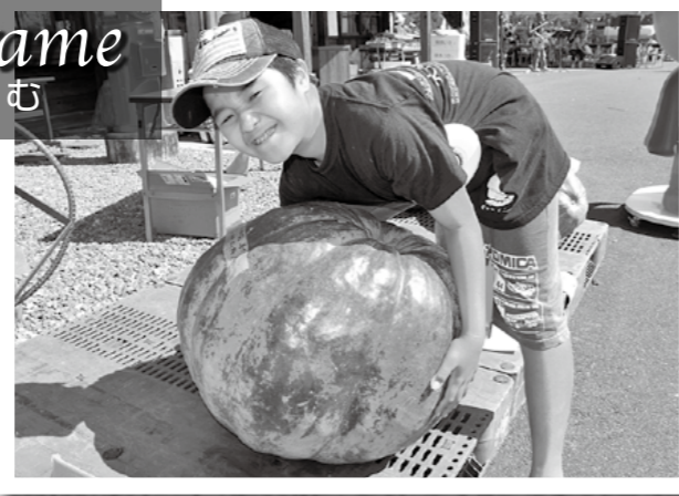
ビッグパンプキン重量コンテストが10月6日、大隅横川駅であり、市内外から23個が出品され1位になったのは52kgの巨大カボチャでした。