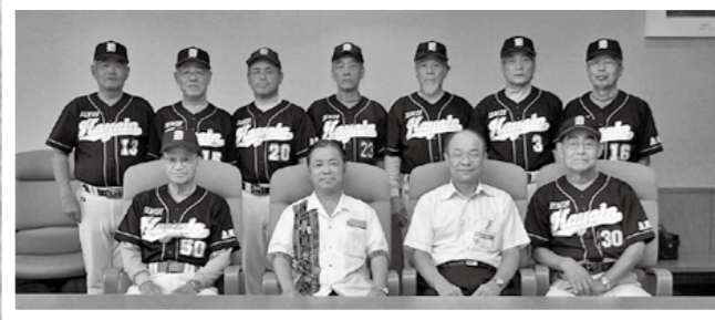
10月26日から高知県で始まるねりんピックのソフトボールに出場するシニア単人の選手9人が9月27日、出場の報告に市役所を訪れました。