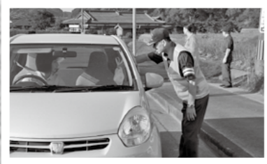
← 9月25日、霧島地区で秋の交通安全キャンペーンがあり、地元小学生が書いた交通安全メッセージをドライバーに手渡しました。