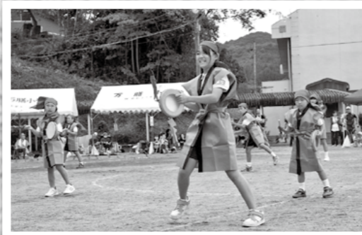
9月29日の万膳小学校秋季大運動会で京セラ国分工場から寄贈された太鼓を使った沖縄のエイサー踊りが披露されました。