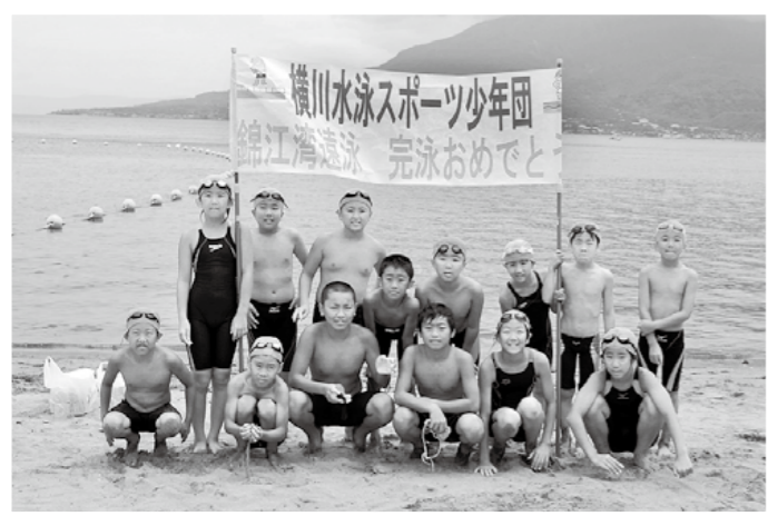
横川水泳スポーツ少年団が7月28日、錦江湾横断遠泳にチャレンジ。12人全員が見事に泳ぎ切りました。