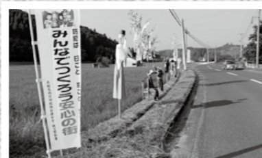
牧園9区自治会が同地区内の道路にかかしを並べて、ドライバーに交通安全を呼びかけました。