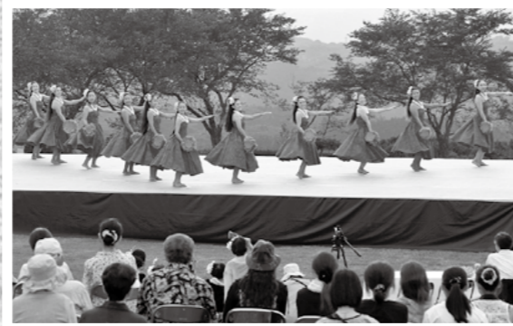
「ありがとう霧島!感謝フェス!」が9月7、8日、霧島高原まほろばの里で開催され、霧島フラフェスティバルと音泉の祭典に多くの観客が訪れました。