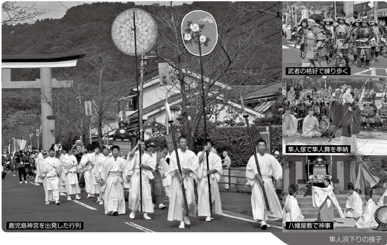
武者の格好で練り歩く