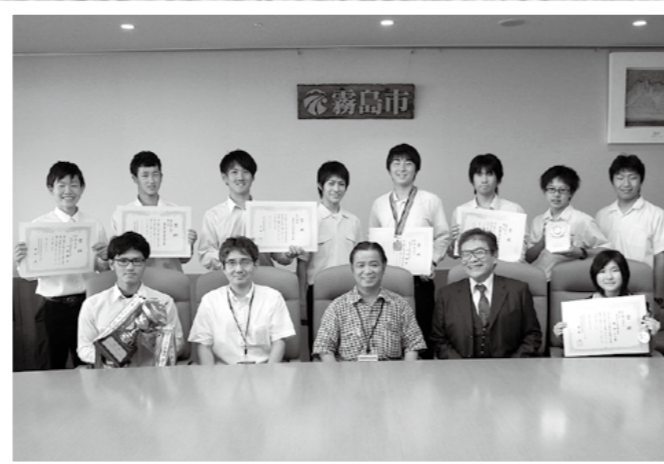
鹿児島工業高等専門学校空手道部が西日本地区高等専門学校空手道大会で総合優勝し、8月8日市役所を表敬訪問しました。