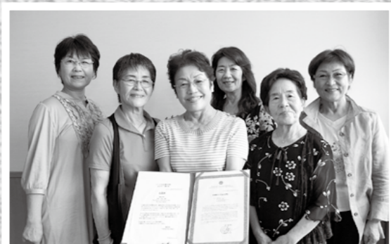
ベトナムで8月に開催された日本伝統文化公演に参加した郷土民謡研究会「さわやか会」が9月9日、報告のため市役所を訪れました。