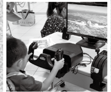
機体見学や制服着用など楽しいイベントが盛りだくさんの空の日フェスティバルが9月7日、鹿児島空港であり、大勢の家族連れでにぎわいました。