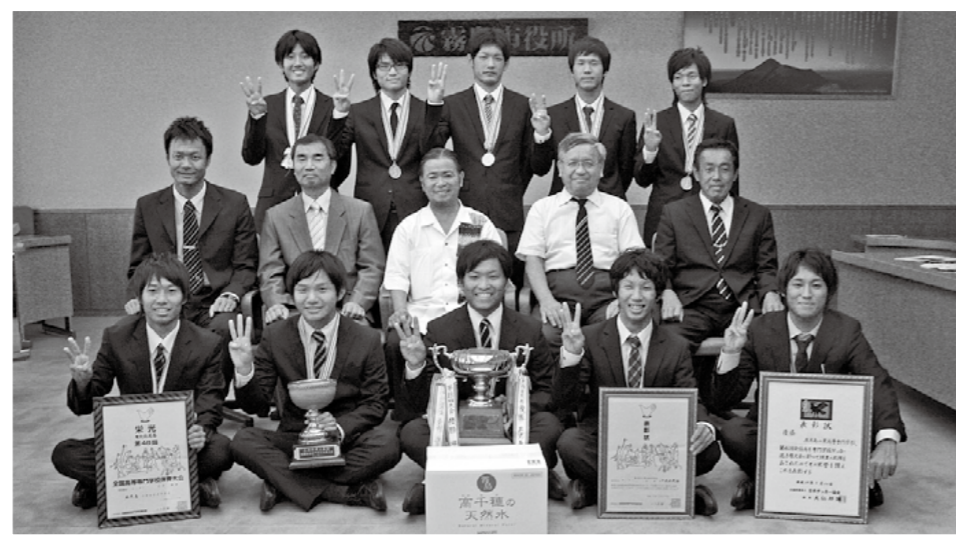
鹿児島工業高等専門学校サッカー部が全国大会で3年連続、23回目の優勝を飾り、9月10日に市役所を表敬訪問しました。