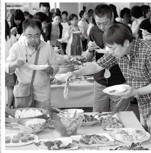
霧島国際音楽祭の関係者をもてなそうと地元のグループ「霧島かあさんの台所」が8月1日、みやまコンセールでランチバイキングをしました。