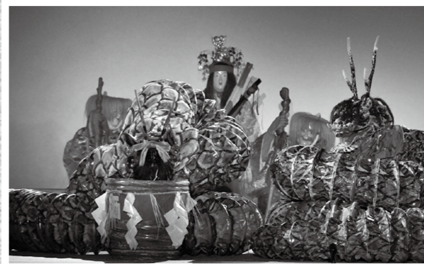
天孫降臨霧島祭が8月24日、25日に霧島神宮特設ステージとみやまコンセールで開催され、多くの観客が神楽の舞と太鼓の演奏を楽しみました。