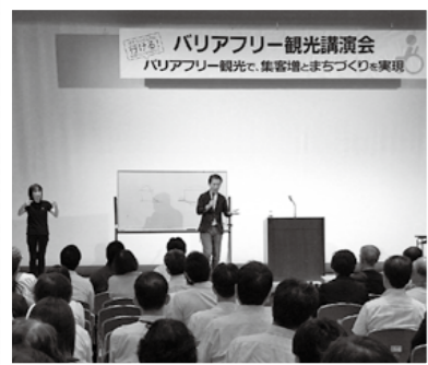
バリアフリーを観光集客とまちづくりに生かす講演会が9月9日、シビックセンターでありました。