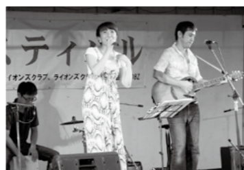
天降川フェスティバルが8月25日、天降川河川公園出会の広場で開催されました。