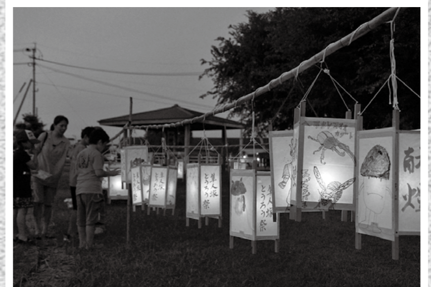
文化財少年団とうろうの夕べが8月8日、隼人塚公園であり、参加した子どもたちは自作の灯籠に入っていました。