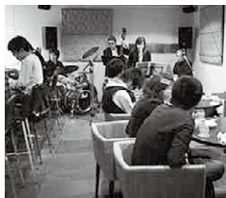
昨年のきりしまバル街の様子

● 販売場所 国分山形屋、霧島商工会議所ほか ◎問 鹿児島バル街実行委員会 ☎(48)6011