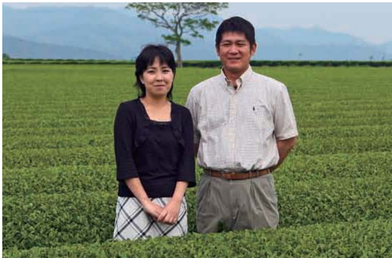
5月15日 溝辺町稜北地区茶畑にて

Kirishima City Public Relations, Japan 2006.5 VOL.11