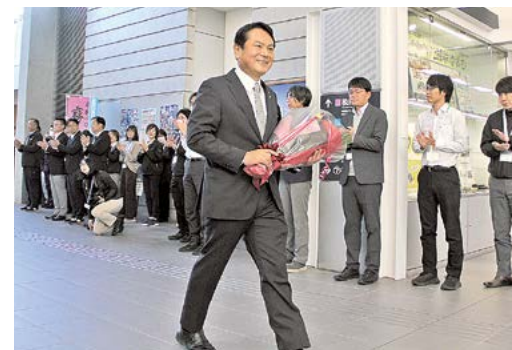
11月18日、市長登庁セレモニー

国分出身。向花小学校、国分中学校、加治木高校、早稲田大学を卒業。平成14年、国分市議会議員に初当選。その後、霧島市議会議員、県議会議員、霧島市長を務める。趣味は釣りと多趣味。国分在住。