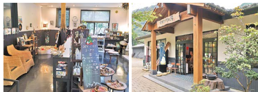
大人も子どももくつろげるロビー