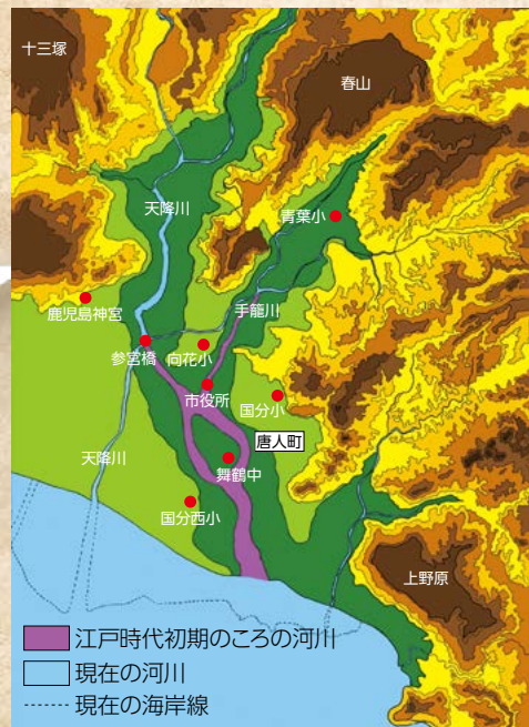
天降川筋直し絵図

大雨のたびに氾濫する川は、家や田畑を押し流し、周りで暮らす人々の生活を脅かしました。寛文元(1661)年、水害で困っていることを知った薩