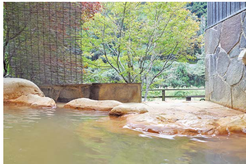
大自然に臨むテラス付きの露天風呂

管理者から一言 ／泉質は、新陳代謝を活性化し「美肌の湯」とも呼ばれる炭酸水素塩泉。全て個室で、隠れ家のような部屋や天降川を目の前に臨み、大自然を感じながら入浴できる露天風呂が付いた部屋もあります。心ゆくまでゆったりとした温泉時間をお過ごしください。