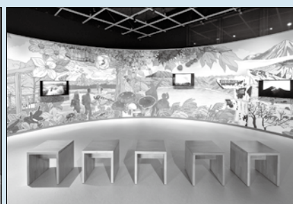
高千穂ネイチャー 霧島山の成り立ちや 豊かな自然の魅力と特徴を紹介