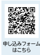
申し込みフォームはこちら

結婚を希望する人の「出会い」のきっかけをつくる出張窓口を開設します。入会登録、登録会員の閲覧ができます。 ●日時=10月9日(日) 午前9時45分～午後4時 ●場所=国分公民館中研修室 ●対象=独身の20歳以上 ●定員=先着10人 ●登録料=1万円(2年間有効)