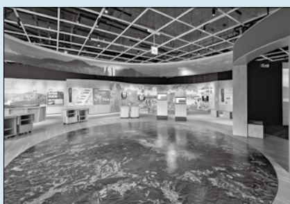
高千穂アクティブサロン 災害時には避難所にもなる 多目的スペース