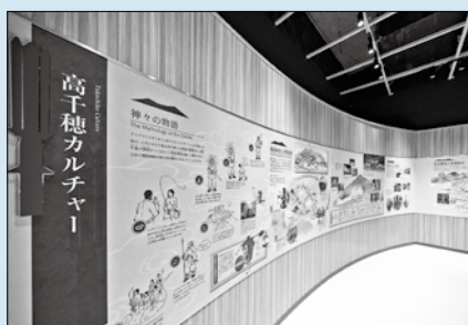
高千穂カルチャー 高千穂に伝わる神話や歴史など 人と文化に関わるエピソードを紹介