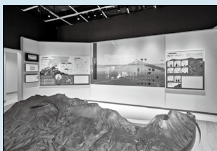
高千穂ナウ 霧島山の気象や季節の花など 最新情報を案内