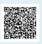
特設サイトはこちら