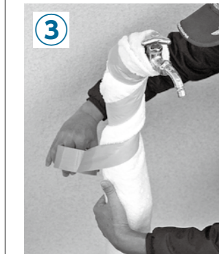
③ 上から布テープなどで縛り、固定すれば完成。