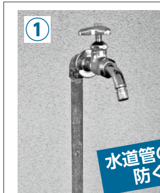
① むき出しの水道管。