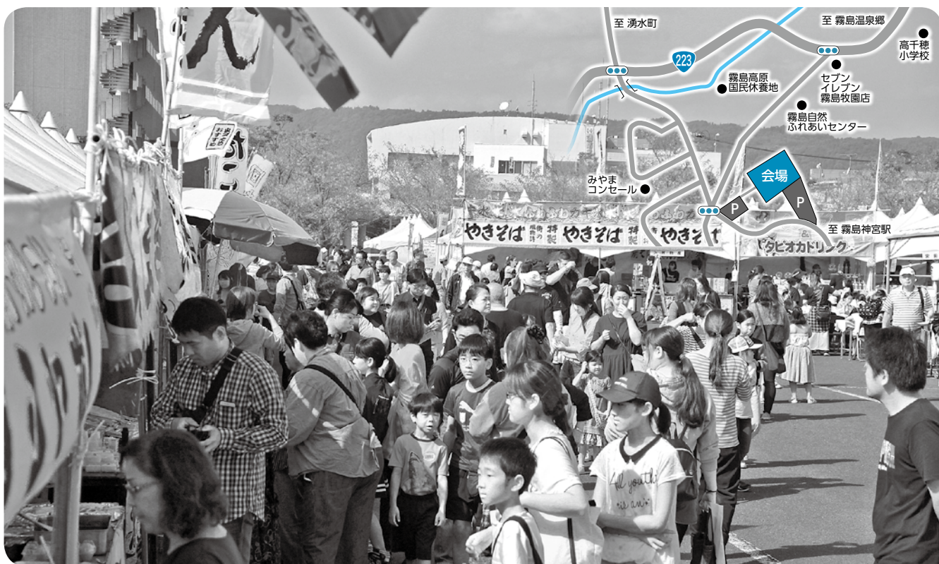
市内各地の特産品などのブースが並ぶ昨年の霧島ふるさと祭