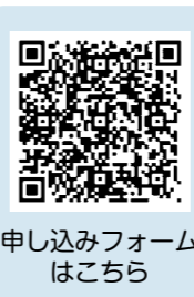
申し込みフォームはこちら