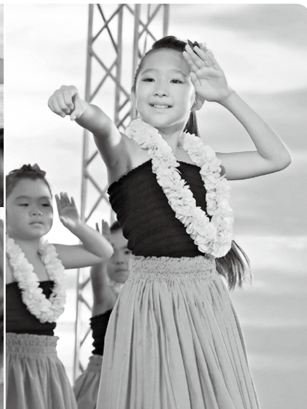
昨年、盛り上がりを見せた同イベントの様子