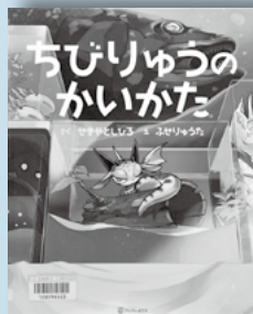
ちびりゅうのかいかた