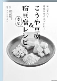
こうや豆腐 & 粉豆腐 幸せレシピ