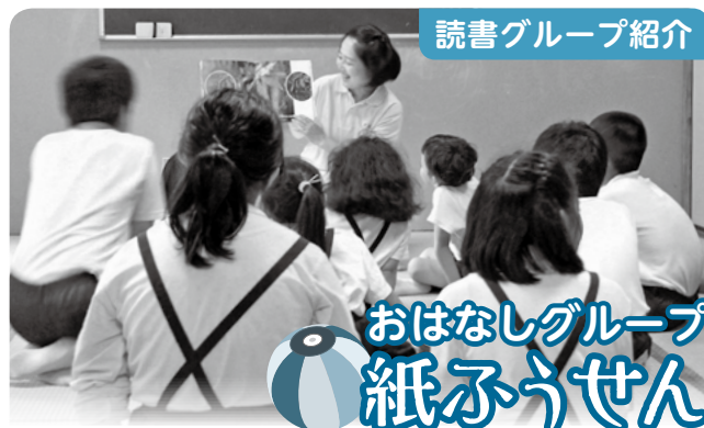
読書グループ紹介